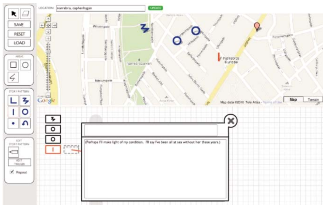
Fig. 5, Interfaccia di programmazione di Storytrek (Greenspan 2011).