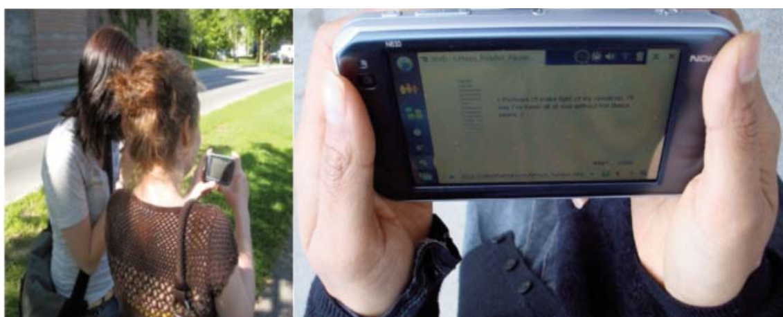
Fig. 6, Crisis 22 (Greenspan 2011).

L'esperienza narrativa, quindi, è data dall'intersezione della storia con l'ambiente in cui si muove il lettore. L'ideale ultimo è ancora di tipo politico-utopico, perché persegue un'esigenza di riforma visionaria del tessuto sociale di appartenenza del lettore, mediante la trasformazione della lettura decontestualizzata tipica del modello cartaceo in un'interazione creativa con lo spazio, in grado di configurare immaginari alternativi: