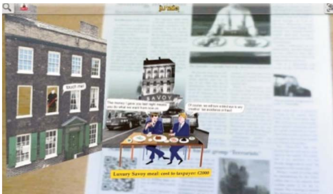
Fig. 7, D. Miller, Sherwood Rise , http://davemiller.org/sherwood_rise/