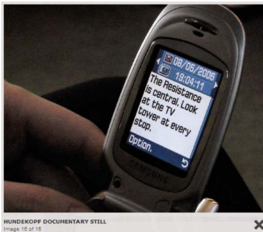
Fig. 4, Knifeandfork, Hundekopf http://knifeandfork.org/hundekopf/

all'utente di volta in volta un testo significativo rispetto al panorama visibile dal treno. I messaggi SMS invitano a offrire uno sguardo nuovo ai luoghi abituali attraversati e alle persone che condividono gli stessi spazi (vedi Fig. 4).