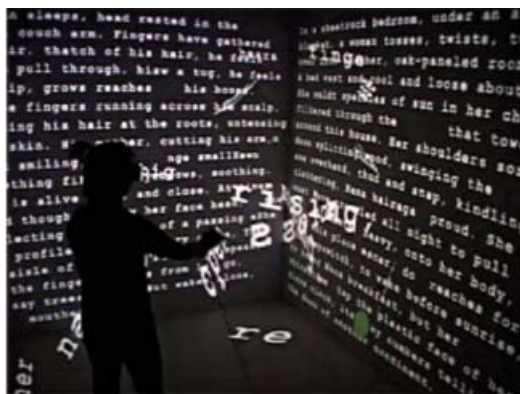
Fig. 3, Judd Noah Wardrip-Fruin, Screen , http://collection.eliterature.org/2/works/wardrip-fruin_screen.html .