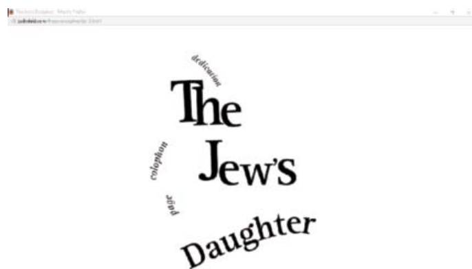
Fig. 1, Judd Morrissey, The Jew's Daughter , http://judisdaid.com/thejewsondaughter/tjd_2.html .

La convenzione più radicata del libro, la pagina, è per esempio il paradigma compositivo fondante dell'opera di Judd Morrissey The Jew's Daughter (2000) 2 . La ripresa dell'articolazione grafica della pagina cartacea è evidente dalla prima schermata, che funziona da sommario delle sezioni, definite in assonanza con il cartaceo come dedication , page , colophon (vedi Fig. 1). Corrispondente all'opera vera e propria è la sezione page : un'unica schermata testuale in cui alcune parole o parti di parole sono evidenziate in blu, a simulare non solo la pagina cartacea ma anche la struttura del link ipertestuale del web. Quando il lettore punta il mouse sulle aree in blu, alcune frasi si sostituiscono nella pagina a quelle precedenti, più velocemente della capacità dell'occhio di catturare con esattezza la sostituzione (vedi Fig. 2). Il titolo dell'opera allude all' Ulysses di Joyce, tramite il riferimento a una ballata, The Jew's Daughter , inclusa nell'episodio 17.