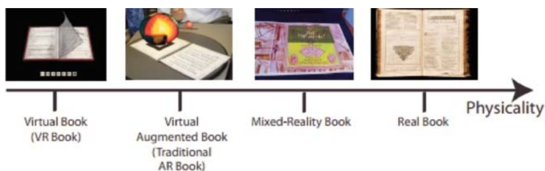
Figure 1: The Physicality continuum

Se la premonizione di Marinetti si sta realizzando soprattutto in ambito cinematografico, nel contesto editoriale oggi si tende a seguire la direzione tracciata dal New York Times , proponendo contenuti in realtà virtuale che sono concepiti come estensione di supporti cartacei tradizionali e che di solito non necessitano di apparecchiature complesse, come caschi o altri strumenti dedicati, ma funzionano con semplici occhiali integrabili con strumenti mobile , come i Google Cardboard. Avventurandosi nel campo nuovo della lettura in realtà virtuale, infatti, i lettori preferiscono, si è dimostrato, continuare ad avere come riferimento il libro cartaceo, per la sua tangibilità che appaga l'idea di possesso e garantisce un'alta qualità grafica. Le realizzazioni attuali tendono quindi a fornire una sintesi di cartaceo e virtuale (Ha, Lee, Woo 2011), inserendosi nella categoria della realtà aumentata: «Augmented reality (AR) is a technological approach which enables that the real and the virtual be viewed in the same place by supporting the real world with 3D virtual objects and enhances the user perception» (Hakan A., Kesim M. 2016). Definendo un continuum che va dal libro reale, interamente fisico, al libro virtuale, in cui il formato è completamente elettronico e non è presente alcun elemento di fisicità, il libro aumentato si colloca al centro, così come è definito dal modello messo a punto da Grasset, Dünser, Billingham (2008):