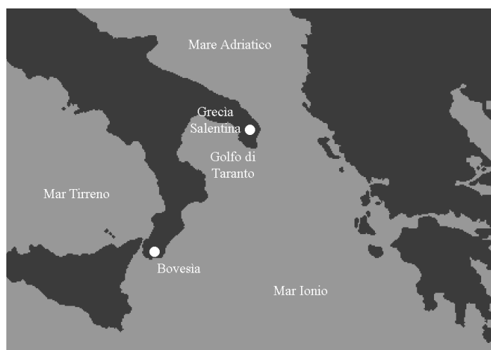
Fig. 1 – Localizzazione sommaria delle aree d'insediamento delle comunità storiche di lingua greca in Italia.

In questo contributo, dopo una breve presentazione delle condizioni storiche, demografiche e sociolinguistiche delle due aree di diffusione delle parlate greco-italiote (calabrese e salentina), sono presentate alcune caratteristiche linguistiche generali e sono approfondite alcune condizioni di realizzazione dei vocoidi di un campione di parlanti di varia origine. Oltre alla necessità di seguire le raccomandazioni degli organismi internazionali che vigilano sullo stato delle lingue minacciate di estinzione, il contributo sottolinea l'urgenza di procedere all'allestimento di archivi di dati sonori sulla lingua 'autentica' realmente parlata, più che continuare a concentrare l'attenzione su modalità di scrittura anacronistiche che non tengono conto delle reali condizioni fonologiche di queste lingue, ma si rifanno a quelle delle principali lingue di alfabetizzazione degli operatori. All'esigenza di aggiornare il lessico con prestiti forzati dai serbatoi linguistici nazionali o, comunque, da una lingua-tetto spesso ignorata dalla maggior parte dei parlanti, questo contributo preponde l'urgenza di assicurare la trasmissione intergenerazionale preservando le specificità locali (cfr. Profili 1996).