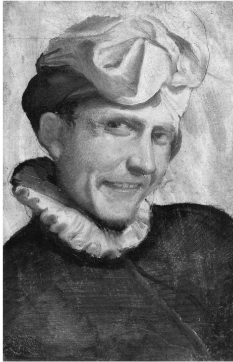
Annibale Carracci, Giullare , 1583, Galleria Borghese, Roma

itinerario etico il pentimento è momento essenziale, il baricentro intorno a cui ruota il lento delinarsi del profilo ideale di una persona – senza traccia di rimozione, senza essere tentati dal voler diminuire l'importanza dell'attimo oscuro, sorgivo dell'intuizione di un qualsivoglia ideale personale, nonché dal voler censurare l'affannosa ricerca di un tale modello, idea guida che ci ha indotti ad attraversare la regione umbratile dei sensi e della materia in vista della riuscita della forma e della pienezza delle fattezze di un volto. Ciò che si è, così come si appare a noi stessi e agli altri, è il frutto di un processo di autoformazione allo stesso tempo ispirato ( intuizione ) e passato attraverso la dura prova del mondo ( esecuzione ) – e si tratta di una regione insidiosa, greve, intessuta di elementi chiaroscurali che sono ben noti alla pittura 'sensuale' e 'materica' di Annibale. Intuizione ed esecuzione, ispirazione ed eroismo dell' azione este-etica , Dea Pittura ed elemento caotico dello sfondo, non devono mai andar disgiunti: l'opera di Annibale (in cui occorre annoverare anche se stesso come frutto di un processo di autoformazione) vive della tensione generata da questa polarità. Una simile tensione dà vita a un processo di trasfigurazione alchemica dell'immagine del Sé, la quale trova la propria raffigurazione dinamica su una tela che, per essere precisi, più che un ritratto è la raffigurazione del proprio auto-ritrarsi .