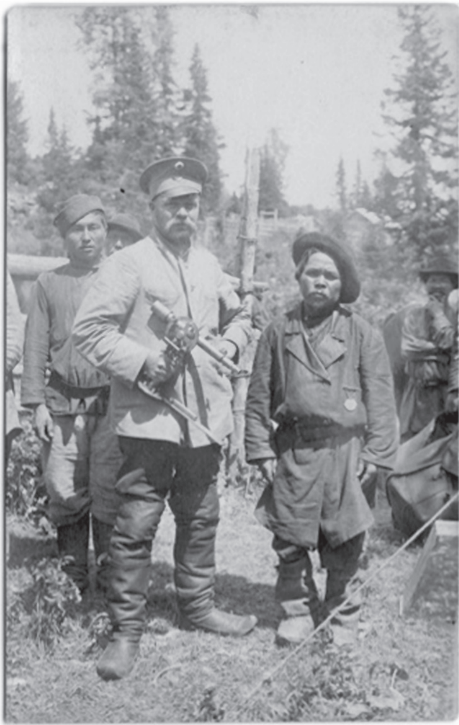
FIG. 1. Agrimensore e capovillaggio, 1913. Museo etnografico statale dell'Altaj.