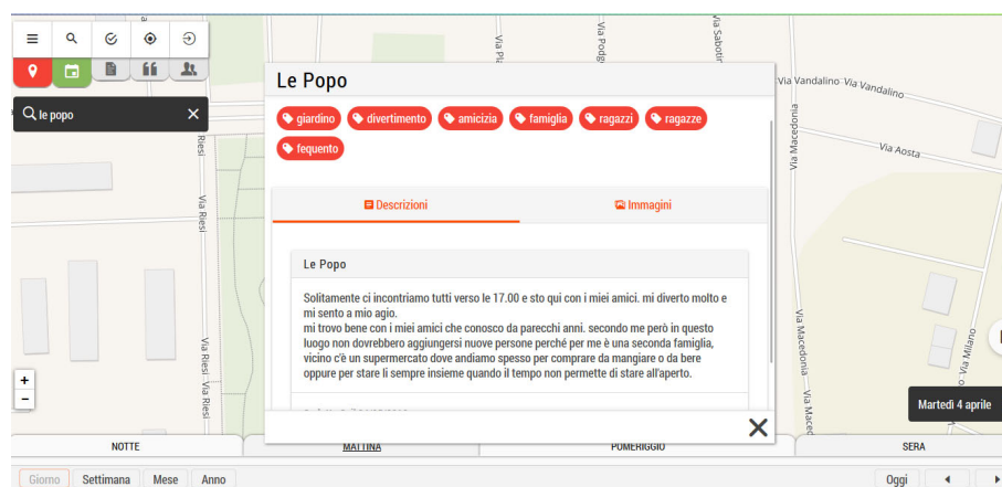
Fig. 1 – Un esempio di luogo di ritrovo informale segnalato dai ragazzi e dalle ragazze durante il processo di mappatura partecipata del progetto Teencarto.

A ciascuno di loro è stato infine chiesto di esprimere una valutazione delle trasformazioni percepite dei luoghi che hanno mappato. I punti sono stati organizzati e visualizzati sulla carta attraverso un sistema di dieci categorie, che coprono la maggior parte delle attività che i ragazzi svolgono in città (luoghi di incontro; locali serali e notturni; cibo; arte, cultura e intrattenimento; istruzione e formazione; hobby e sport; lavoro; negozi; servizi; io immagino).