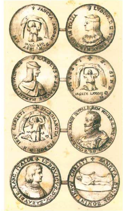
Fig. 2. Stampa raffigurante medaglie commemorative della Sindone