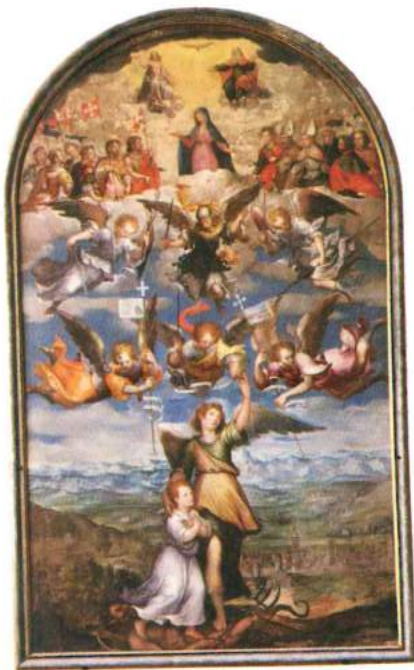
Fig. 6. Antonino Parentani, Gloria di Maria e un angelo custode , olio su tela, 1604, Torino, Cattedrale