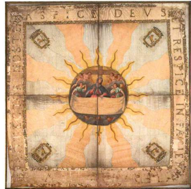
Fig. 7. Stendardo sindonico della città di Torino, 1640, Torino, convento di San Domenico