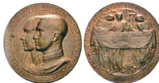
Fig. 3. Medaglia commemorativa della Sindone del 1931