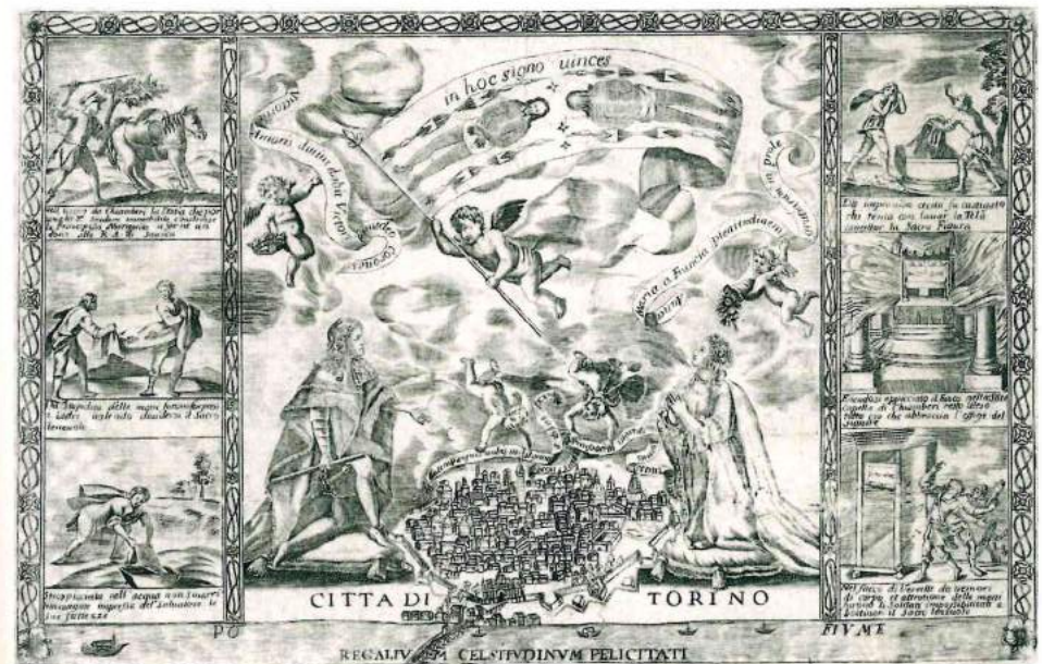
Fig. 8. Vittorio Amedeo II e Anna Maria d'Orléans venerano la Sindone, Incisione a bulino, 1684 circa