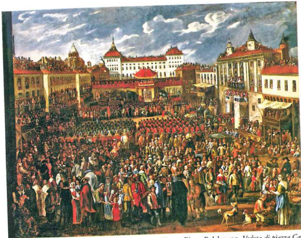
Fig. 5. Pieter Bolckmann, Veduta di piazza Castello in occasione di un'ostensione , olio su tela, 1686, Racconigi, Castello Reale, inv. R 6669-45