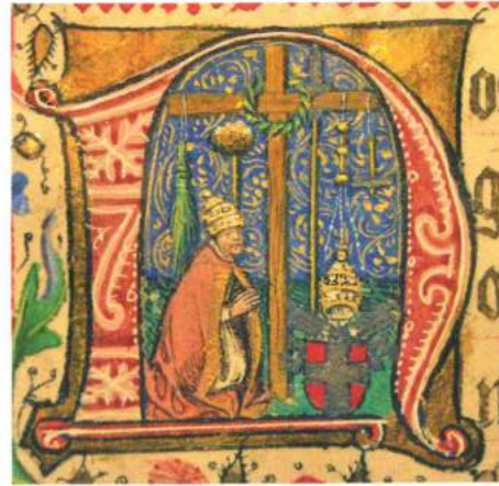
Fig. 1. Felice V venera le reliquie della Passione, Biblioteca Reale di Torino, Varia 168, f. 24r