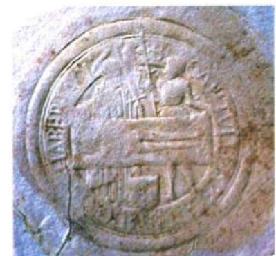
Fig. 4. Sigillo del capitolo della Sainte-Chapelle di Chambéry (XVI secolo)