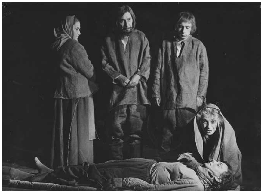
Figura 24. Madre Courage china sul corpo di Kattrin. Alle sue spalle, la famiglia di contadini a cui affiderà la sepoltura della figlia.