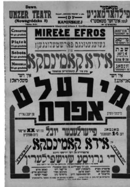
Figura 9. Manifesto bilingue (polacco e yiddish) di una rappresentazione di Mirele Efros a Varsavia. Ventennio tra le due guerre.