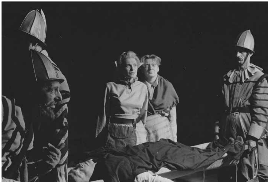
Figura 23. Scena III. Madre Courage rinnega il figlio, condannandolo a una sepoltura poco onorevole.