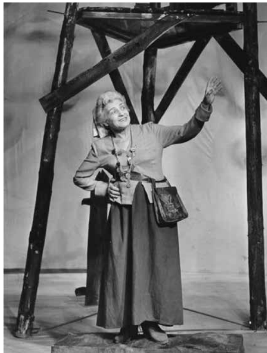
Figura 20. Scena vi. Madre Courage al culmine della propria carriera di commerciante.