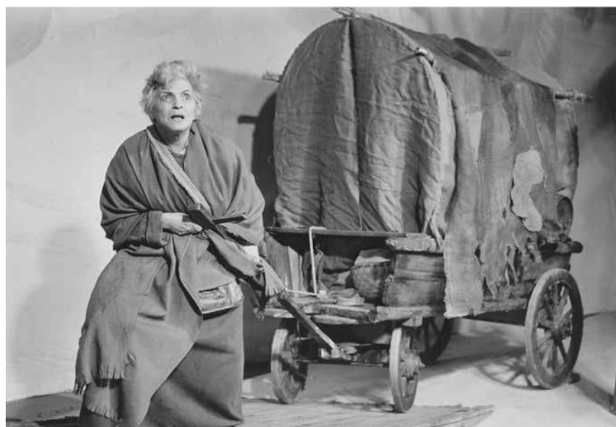
Figura 25. Rimasta sola, Madre Courage si riattacca ancora una volta alle stanghe del carro e riprende il cammino.