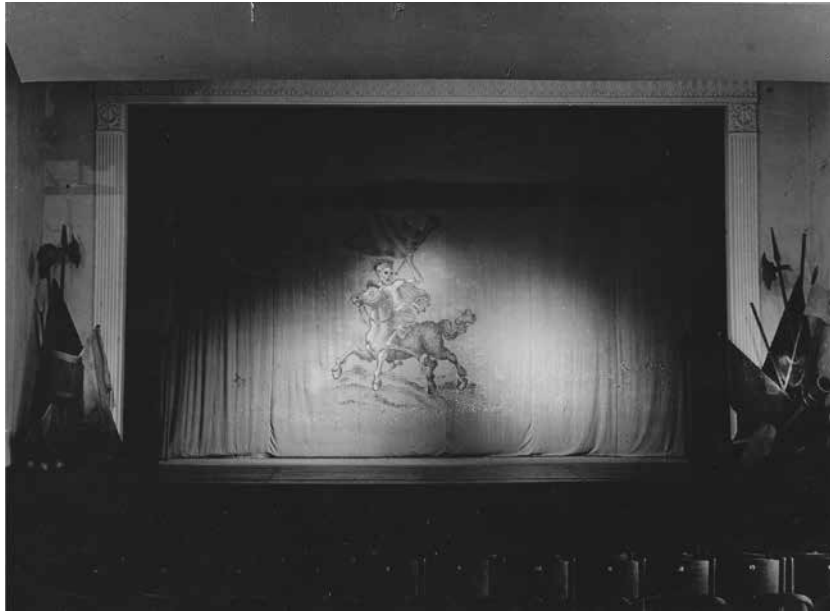
Figura 18. Il sipario di Mutter Kuraj un ire kinder .