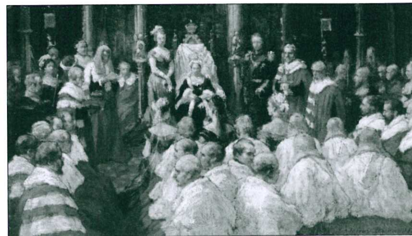
Incoronazione e apertura del Parlamento da parte della Regina Vittoria e La House of Lords nel 1808.