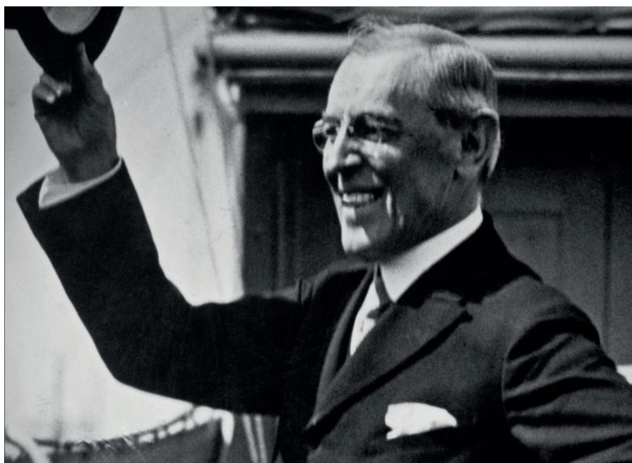
Thomas Woodrow Wilson

Come sostiene John Milton Cooper, “la figura di Wilson e quella di Theodore Roosevelt si stagliarono, agli albori del secolo americano, allo stesso modo di quelle di Thomas Jefferson e Alexander Hamilton all’inizio dell’Ottocento. Come Jefferson e Hamilton rappresentarono gli architetti politici del diciannovesimo secolo, così Wilson e Roosevelt furono i primi artefici istituzionali del Novecento 1 ”. Parte della storiografia statunitense sembra convergere su questa tesi, riconoscendo sia a Roosevelt sia a Wilson l’indiscusso statuto di “cultural icons” (simboli culturali) della politica estera americana di inizio Novecento 2 . Si insiste infatti sulla eccezionalità della figura di questi presidenti nell’aver interpretato e, allo stesso tempo, reinterpretato le due principali correnti di pensiero della politica estera degli Stati Uniti (e cioè il realismo e l’internazionalismo liberale 3 ). Eppure, non si può non ricordare la ben nota frase che Wilson aveva detto ad un amico il giorno del suo insediamento alla Casa Bianca: