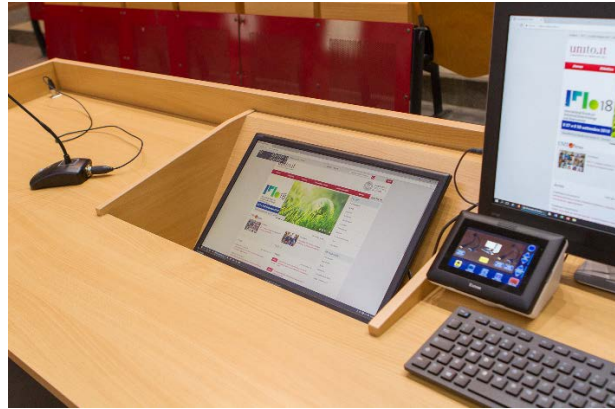
Figura 3 - Cattedra docente con postazione di controllo

In pochi passaggi il docente inserendo il suo nome utente di Ateneo può avviare una registrazione custom e caricarla sulla repository Kaltura, per poi gestirla e pubblicarla nel proprio corso su Moodle. Al momento della registrazione il docente può agire sul sistema di controllo per orientare la videocamera e combinare il flusso principale con uno secondario (ad esempio pc portatile con slide).