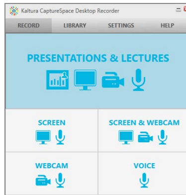
Figura 1 – Aspetto del recorder di Kaltura CaptureSpace