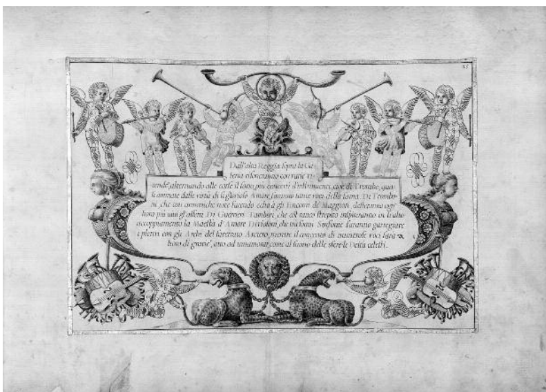
1 GIOVANNI TOMMASO BORGONIO Gli Ercoli domatori de mostri, et Amore domatore degli Ercoli. Festa a cavallo per le Reali Nozze della Serenissima Principessa Adelaide di Savoia e del Serenissimo Principe Ferdinando Maria Primogenito dell'Altezza Elettorale di Baviera, 1650, tempera su carta e cornice in oro, 405 x 570 mm, Torino, Musei Reali- Biblioteca Reale, Storia Patria 949, c. 37.