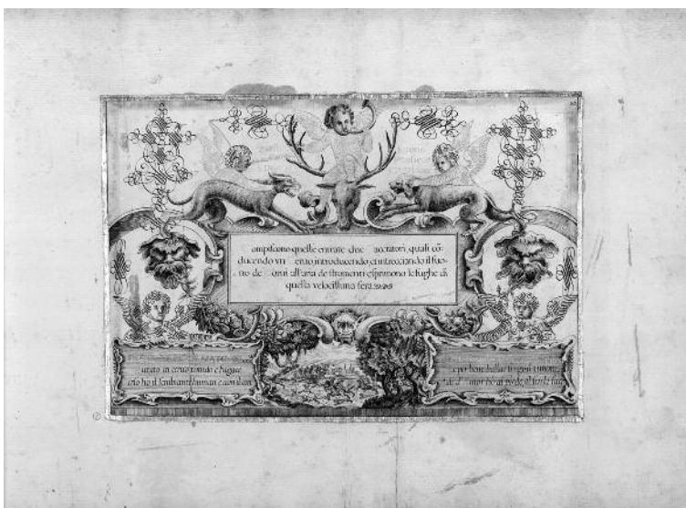
5 GIOVANNI TOMMASO BORGONIO Hercole et Amore Applaudenti al Natale di M.R. Gran balletto Per li dieci Febraro 1640 Ballato in Chambéry , tempera su carta e cornice in oro, 400 x 505 mm, Torino, Musei Reali- Biblioteca Reale, Storia Patria 952, c.33.