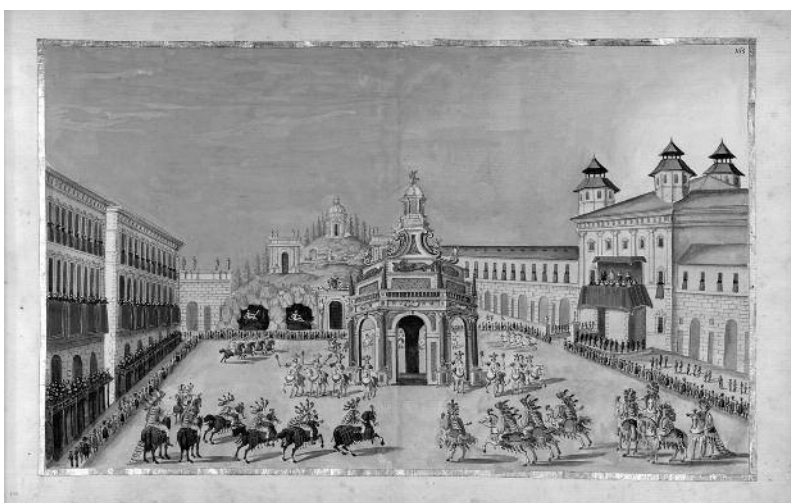
2 GIOVANNI TOMMASO BORGONIO Gli Ercoli domatori de mostri, et Amore domatore degli Ercoli. Festa a cavallo per le Reali Nozze della Serenissima Principessa Adelaide di Savoia e del Serenissimo Principe Ferdinando Maria Primogenito dell'Altezza Elettorale di Baviera, 1650, tempera su carta e cornice in oro, 405 x 570 mm, Torino, Musei Reali- Biblioteca Reale, Storia Patria 949, c. 291.