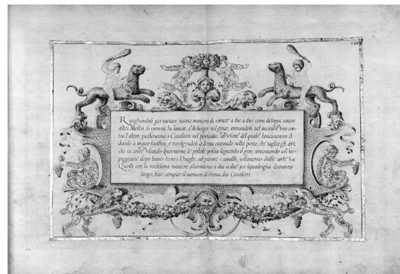
7 GIOVANNI TOMMASO BORGONIO Gli Hercoli domatori de mostri, et Amore domatore degli Hercoli. Festa a cavallo per le Reali Nozze della Serenissima Principessa Adelaide di Savoia e del Serenissimo Principe Ferdinando Maria Primogenito dell'Altezza Elettorale di Baviera, 1650 , tempera su carta e cornice in oro, 405 x 570 mm, Torino, Musei Reali- Biblioteca Reale, Storia Patria 949, c. 23.