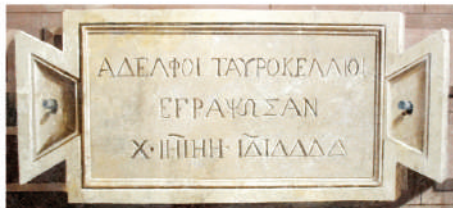
La firma dei Fratelli Torricelli nell'atrio di Palazzo Grosso di Riva presso Chieri, Torino.