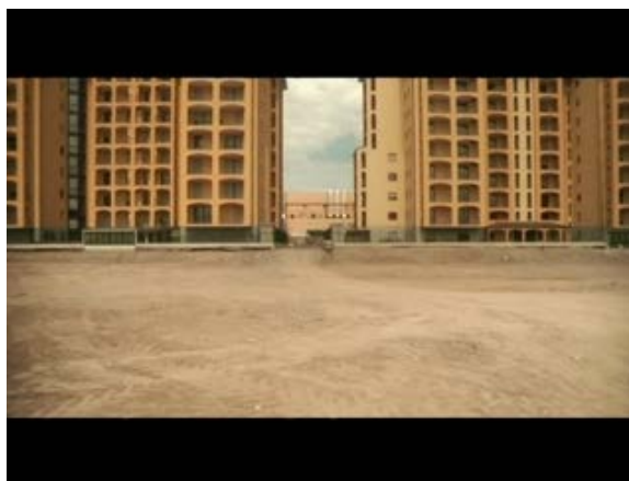
Figura 1. Spazi urbani deserti (fotogramma dal film Come l'ombra , Marina Spada, 2006)

La parte iniziale della vicenda narrata – ovvero la vita di Claudia prima dell’incontro con Olga – si distende dentro spazi che attendono di essere percorsi. La flânerie appartiene a una camera che muove per viali, spiazzi, vie ferrate come a invitare Claudia, e con lei chi guarda, a esplorare il paesaggio urbano. I luoghi del film si dipanano sullo schermo, spazi che lo sguardo del film saggia quasi offrendoli al corpo della protagonista perché li riempia. La messa in inquadratura ispirata a Gabriele Basilico (1993 e 2007), celebre per l’appunto per il lavoro di fotografo di spazi urbani metropolitani, illumina strade solitarie, parcheggi e spiazzi desolati che la camera di Spada raggela in una serie di immagini fisse: un semaforo lampeggia a un incrocio deserto, le strisce pedonali a segnare un percorso possibile ma inesplorato, osservato dagli occhi di terrazze vuote; una finestra si apre sull’interno di una stanza popolata solo dalla presenza leggera di un’ombra sulla tenda assoluta; l’insegna luminosa di un supermercato brilla nel buio; le linee bianche di un parcheggio sembrano disegnare sull’asfalto un campo da gioco dove nessuno corre (Fig.1).