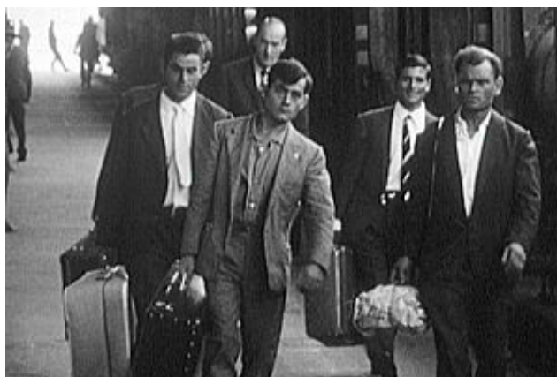
Figura 1. Siamo italiani. Un fotogramma del film

In Siamo italiani , è insomma l'adozione di un ben determinato regime dello sguardo a esprimere la posizione del suo autore nei confronti della materia osservata: un filtro empatico, attraverso il quale mettere a fuoco i desideri dell'immigrato, l'unico, in fin dei conti, che può sentire sulla propria pelle, fino in fondo, la disperata distonia implicita in ogni percorso di sradicamento e il fondo oscuro e umiliante del miracolo economico, i suoi tributi da pagare, affettivi e psicologici. L'inserimento in una forma di società economicamente più avanzata, per quanto desiderato, appare infatti segnato da una rilevante complessità sentimentale, che unisce l'inconfessabile rimpianto della vie antérieure , ricostruita ora a distanza nel paesaggio affettivo e fisico dei luoghi di provenienza, al senso di perdita della correspondence , all'esperienza eroica del riscatto e del coraggio impiegato nel voler ripartire da capo, fino a un'impensabile affermazione economica. Non certo a caso, nelle testimonianze riportate da Seiler, si fondono costantemente un senso opprimente di emarginazione e l'orgoglio derivante dall'acquisizione di un nuovo status, di un finora sconosciuto benessere: come se il coinvolgimento in un sistema produttivo avanzato determinasse inevitabilmente un'insanabile frattura interiore, secondo la quale la percezione dell'avanzamento viene inevitabilmente compensata dalla necessitata accettazione di un'inquietudine e di una distanza (Fig.1).