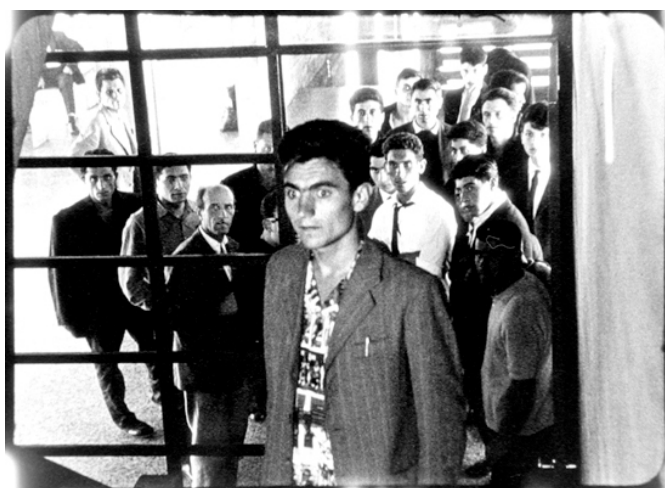
Figura 2. Siamo italiani. Un fotogramma del film

della scrittura e della costruzione retorica e l'apparente silenzio della soggettività autoriale a costituire la "segreta molla emozionale" (Micciché 1965) che muove queste sequenze, e, in genere, l'intero film. Così, nonostante il distacco formale dello sguardo sul reale, l'utopia della trasparenza, anche in Siamo italiani , tramonta di fronte all'urgenza di una presa di posizione e alla spinta ermeneutica che ne rappresenta la motivazione più profonda (Fig. 2).