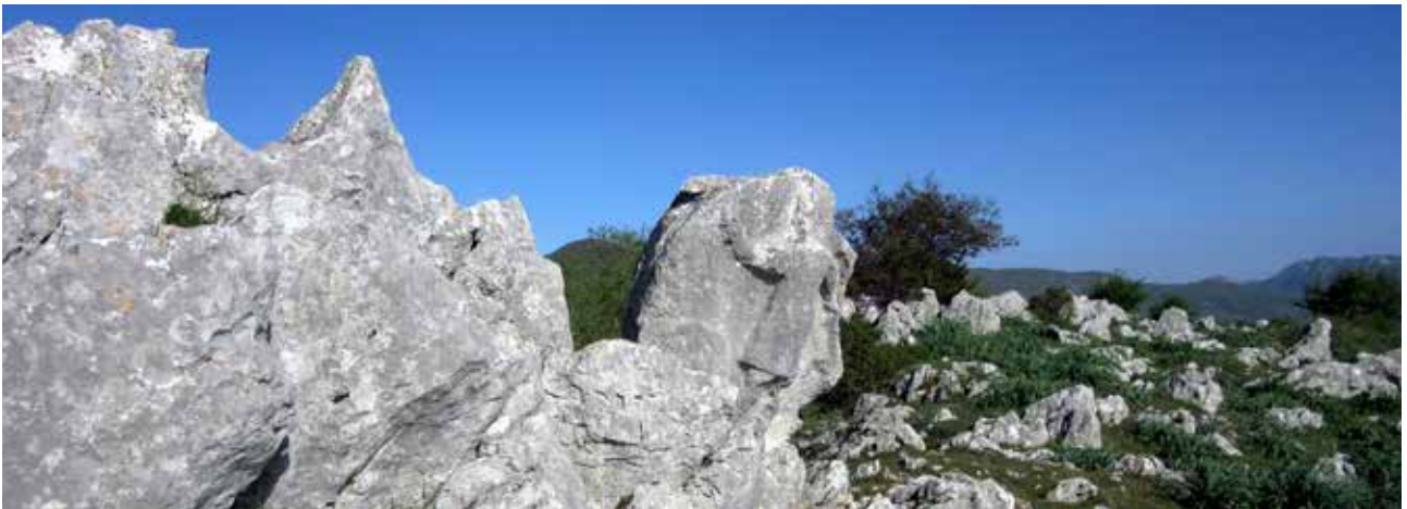
Lastroni calcarei presso la sommità di Costa Palomba, tra i quali l'altorilievo rupestre dell' Antéce

con la faccia lavorata esposta a sud-ovest, a profilo a mandorla, alto circa 2 m, forse in origine quasi rotondo se si considerano gli stacchi distruttivi praticati ai margini. La figura umana è scolpita ad altorilievo, tanto che l'intero manufatto assume quasi la natura di una statua, ed è alta circa 170 cm, quindi a grandezza naturale.