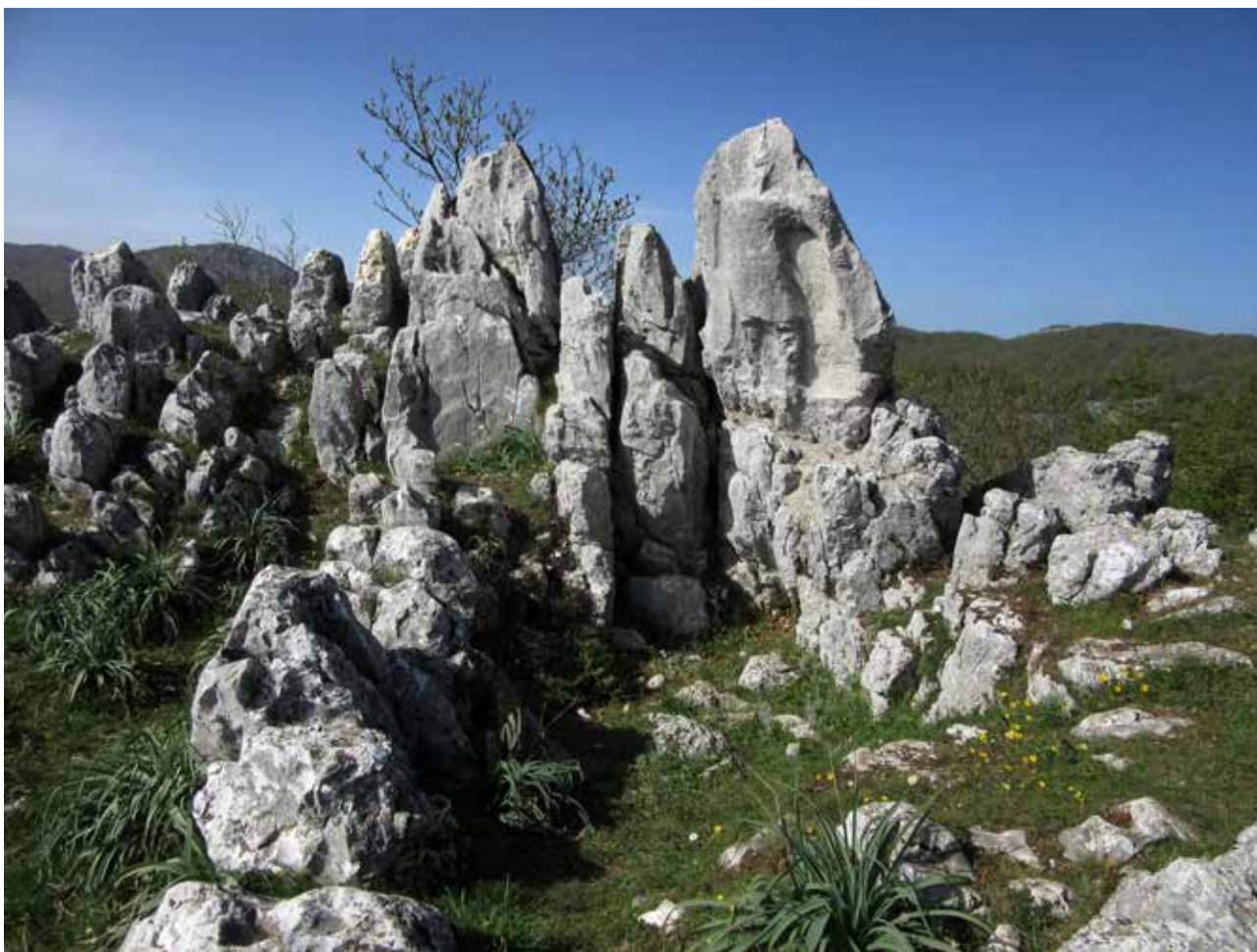
Costa Palomba, l'Antéce, la depressione alla base e i lastroni circostanti

Gli autori proponevano l'attribuzione dei reperti ceramici "ad una fase finale dell'età del Bronzo, forse ad un periodo inoltrato, già orientato in senso protovillanoviano della cultura subappenninica", ipotizzando altresì un attardamento culturale, riservando a più approfondite valutazioni la contestualità o meno della figura rupestre rispetto alle ceramiche del castelliere dell'età del Bronzo, escludendo quindi quelle romane. In STRADI, ANDREOLOTTI 1967 l'argomento viene ripreso, citando altresì la presenza di "scarse tracce di un rozzo muro ad intonaco di probabile età romana"; la descrizione dei reperti ceramici è più dettagliata, oltre che accompagnata da due tavole con disegni di 17 frammenti, tra i quali una capeduncola quasi intera. In CAIAZZA 2020: 47 è riportata la presenza presso l'area sommitale "di una miriade di minuti frammenti di ceramica da fuoco, anche ben depurata, di epoca ellenistica", confermando così una lunga frequentazione antropica. Riguardo al monumento rupestre, sono varie le ipotesi avanzate, relate alla raffigurazione di un guerriero, di una divinità guerresca, di una scultura funeraria o di un defunto eroicizzato (STRADI, ANDREOLOTTI 1967: 167-171). In PICIOCCHI 1977 la situazione viene brevemente riesaminata, attribuendo più correttamente al Bronzo Medio e