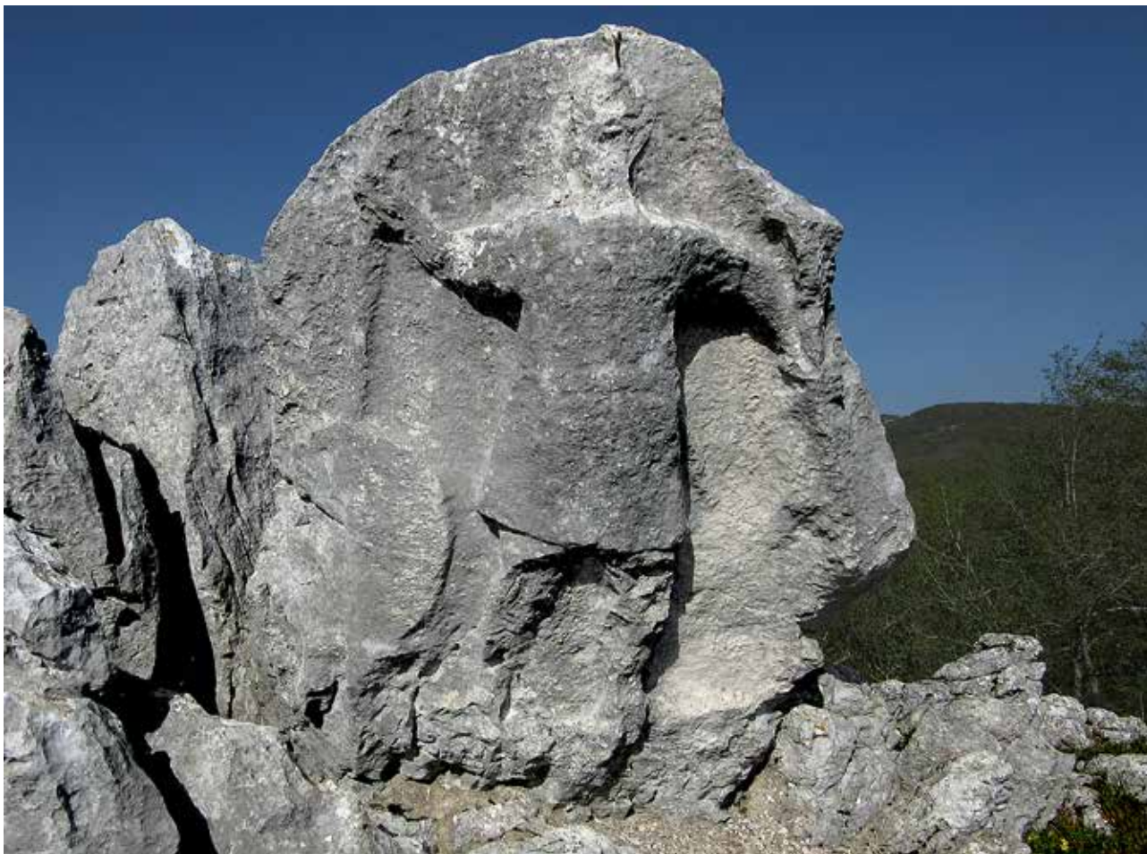
Costa Palomba, l'altorilievo rupestre dell' Antéce ricavato da un lastrone calcareo naturale