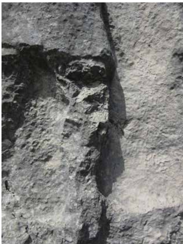
L'Antéce, dettaglio dei danneggiamenti in corrispondenza della gamba sinistra

Il monumento di Costa Palomba è oggi noto soprattutto in ambito escursionistico; manca però un'edizione monografica, e solo recentemente sono stati pubblicati contributi più approfonditi. Le attente disamine esposte in CAIAZZA 2016, 2020 e 2021, che si sono avvalse di un dettagliato esame autopistico e fotografico sotto le opportune condizioni di illuminazione radente, integrano il conosciuto con l'aggiunta di nuovi particolari iconici; per quanto