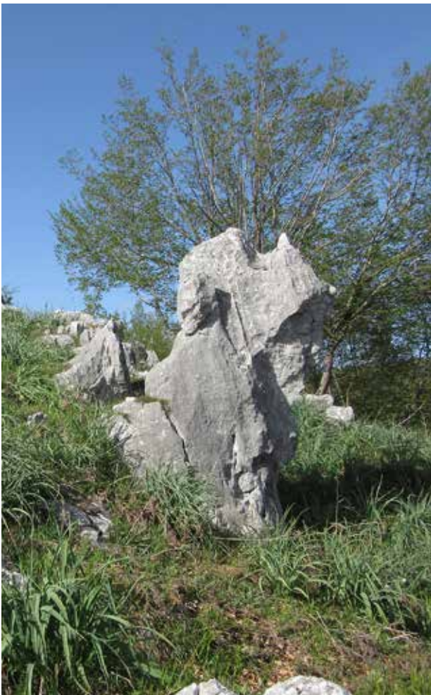
Costa Palomba, lastroni calcarei e degradazione meteorica (foto AA)

quale non si può individuare la cuspide per le lacune da erosione e danneggiamento, alla quale, sempre a terra, è poggiato uno scudo rotondo a profilo leggermente spiovente e incurvato a partire dal diametro verticale di circa 50 cm, più probabilmente dotato di un umbone fusiforme del quale si è quasi persa la forma; nell'altra mano impugna un oggetto allungato, eroso e lacunoso, del quale però si può riconoscere una terminazione distale ad arpione e una prossimale svasata, tanto da potere ipotizzare la presenza di