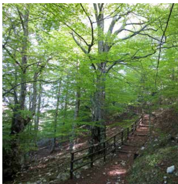
La faggeta lungo il percorso per raggiungere la sommità di Costa Palomba

dapprima lungo una sterrata, che poi diventa un sentiero a gradoni e staccionata di legno attraverso un bel bosco di faggi, 30 minuti in tutto e 100 m di dislivello in salita, più ripida nella parte finale. In corrispondenza della zona sommitale, quasi piana, il lastrone emerge a mo' di stele, o di statua-stele,