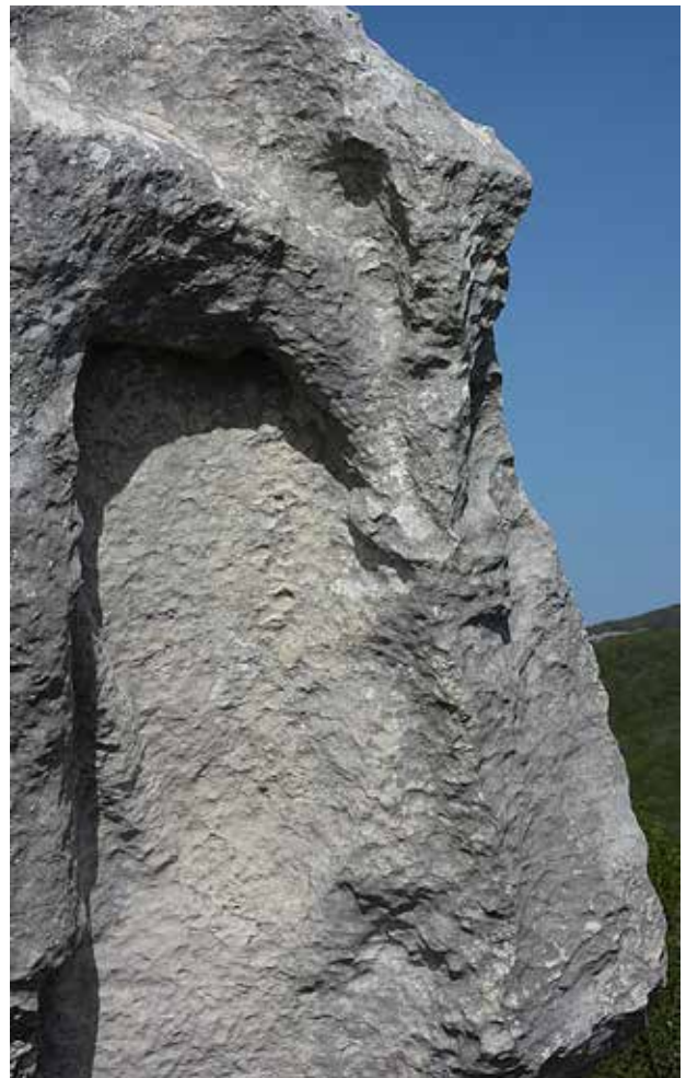
L'Antéce : dettaglio dell'oggetto impugnato con la sinistra