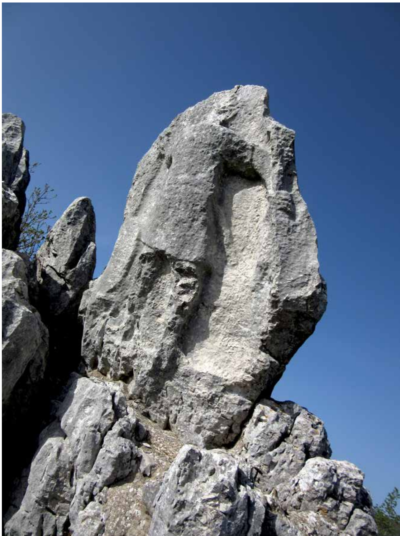
Costa Palomba, l'altorilievo rupestre dell' Antéce , ripresa laterale

a quello romano ha dato: a) abbondantissimi resti di rozza ceramica d'impasto prevalentemente coronata o pizzicata, resti che dovevano fare parte di grossi e voluminosi recipienti; b) alcuni frammenti di ceramica con decorazione incisa (a spina di pe-