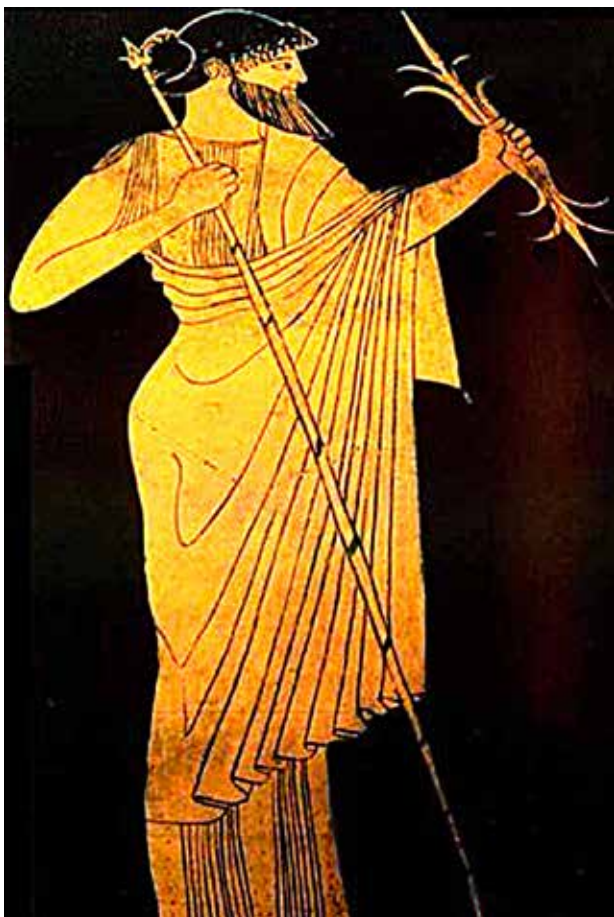
Zeus su di un'anfora panatenaica a figure rosse (480-470 a.C.; Staatmuseum , Berlino)

una folgore o di un fascio di folgori, e da connotare pertanto l'altorilievo rupestre, secondo una possibile lettura, come un effigie di Iuppiter / Zeus , a seconda della cultura di riferimento, o per lo meno dotata degli attributi della divinità delle vette per elezione; delle due mani si possono ancora leggere, a fatica, le tracce delle dita, che fanno presa, incurvate, sulle aste della lancia e dell'altro elemento impugnato; se le braccia sono orizzontali, gli avambracci, uno alzato e l'altro abbassato, formano con la linea delle spalle un profilo sinuoso. Il personaggio indossa una sorta di tunica rigida, che il labile riconoscimento di placche andrebbe a configurare come corazza, che arriva alle ginocchia, maniche che terminano sopra il gomito, e un elmo del quale si possono intravedere, a fatica, orlo, paragnatidi e più sicuramente l'apice, tanto da poterlo definire, sempre con riserva, elmo a pileo, probabilmente a calotta di tipo Montefortino (V-I sec. a.C.); una leggera sagomatura della superficie danneggiata, subito a destra del capo, per chi guarda, mostra altresì tracce di un corno, elemento che contribuisce a confermare la cronologia più verosimile del rilievo rupestre, che gravita attorno al V-IV sec.