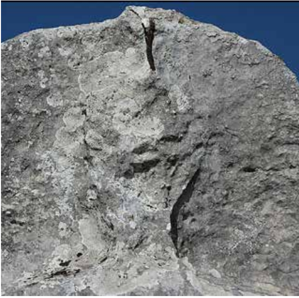
L'Antéce , dettaglio dell'elmo e della testa