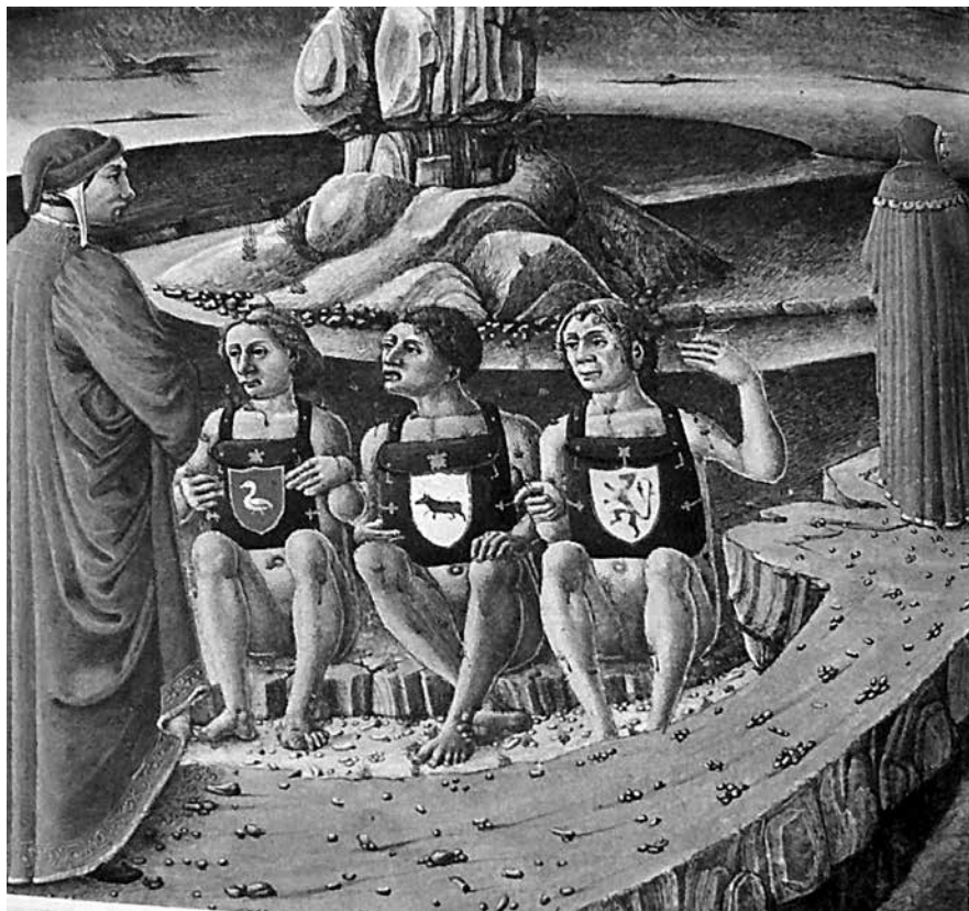
Fig. 1. Dante incontra gli usurai (Inferno, canto XVII, miniatura del XV sec.). I dannati portano al collo una borsa, simbolo del loro mestiere, sulla quale è impresso lo stemma gentilizio: vengono così stigmatizzate le grandi famiglie magnatizie che fanno uso distorto della loro ricchezza.