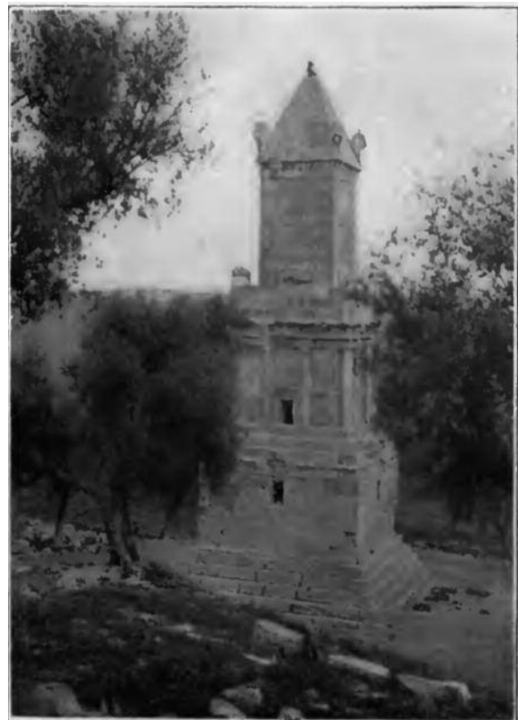
Fig. 2. Il Mausoleo libico-punico di Dougga (Ayer Burbank 1911).

In particolare l'area tunisina ha avuto negli ultimi 25 anni un " boom in field survey archaeology " 10 anche se le missioni archeologiche si sono concentrate maggiormente sui siti e sulle evidenze di età romana, i siti rurali di età punica non sono di minore importanza, come dimostrato dallo studio condotto da Fentress-Docter 11 . Poche pagine sono state dedicate dalla letteratura scientifica all'agricoltura punica, motivate dal " laconisme des sources ". Come ben ci ricorda Cecchini, queste fonti tramite cui conosciamo il "mondo rurale" 12 , fenicio-punico non sono mai dirette e sebbene ci diano delle informazioni tecniche, come quelle di Magone, non parlano mai dei fruitori. Benedict Isserlin imputava questa carenza di interesse verso il mondo rurale al fatto che la maggior parte dell'attenzione degli archeologi fosse rivolta a contesti urbani. Nel suo intervento si auspicava che le stesse metodologie usate per lo studio delle campagne in Italia venissero applicate al periodo fenicio-punico 13 . Continuando la sua riflessione si interrogava su come potesse essere divisa la terra, se si utilizzassero degli