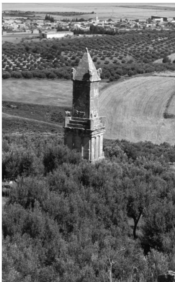
Fig. 3. Il Mausoleo libico-punico di Dougga (Marras A.M. 2006).

possibile ipotizzare la produzione totale di olio. Secondo questo dato e attraverso la combinazione di informazioni etnografiche e statistiche si sono potute ipotizzare sia la quantità della produzione olearia per singolo sito produttivo, sia l'area destinata all'oliveto. I risultati ottenuti sono visualizzati su un GIS e confrontati, attraverso delle operazioni di overlay , con l'uso del suolo attuale.