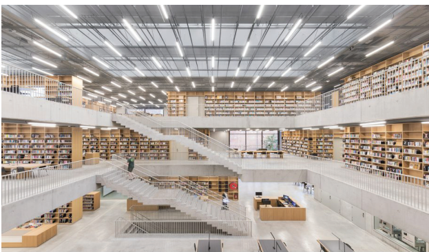
Fig. 2: Un ambiente di Utopia, Aalst .

tra alcuni recenti progetti di biblioteche pubbliche e i contenuti e i valori riconducibili al concetto di 'utopia', nella sua articolata polisemia. Il ragionamento proposto si svilupperà secondo i seguenti passi. In primo luogo verrà effettuata una rapida esplorazione del significato della parola 'utopia', differenziandolo da quello di al-