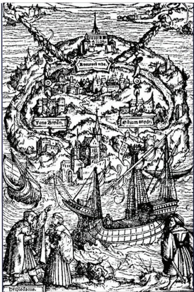
Fig. 1: The island of Utopia [Holbein, 1518].