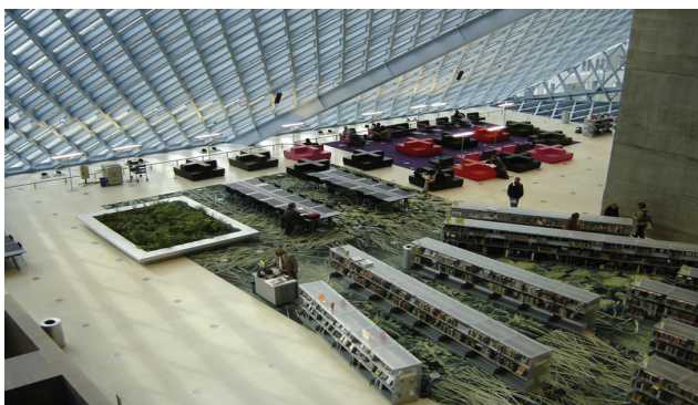
Fig. 3: Disposizione degli scaffali nella Seattle Public Library [Sorgatz, 2005; Zook - Bafna, 2012].

La Seattle Public Library, con la sua inconfondibile silhouette , è stata progettata da Rem Koolhaas e dallo studio di architettura olandese OMA 15 , e inaugurata nel 2004, al termine di un percorso di progettazione ampiamente documentato [Seattle. Office for Metropolitan Architecture - LMN Architect - Rem Koolhaas, 1999; Seattle. Office for Metropolitan Architecture - LMN Architect, 2005]. L’elemento che a me pare più decisamente utopico (nel senso di ‘utopia 2’) riguarda uno degli elementi cardine dell’identità di qualunque biblioteca: l’ordine dei libri. In aree dello spazio della biblioteca localizzate al primo e al terzo piano, come si può vedere con la Figura 3 e con le due immagini della