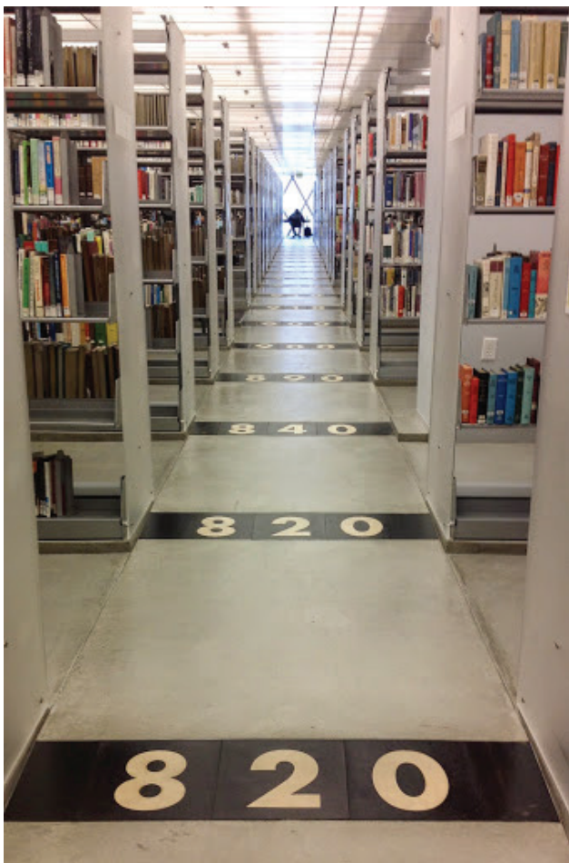
Fig. 5: Scaffali disposti secondo linee parallele; a destra, impresse sul pavimento, le notazioni della Classificazione decimale Dewey [Rosemary's blog, 2015].

Figura 4 [Zook - Bafna, 2012], gli scaffali sono disposti in modo deliberatamente disordinato, secondo linee né parallele né perpendicolari, irregolari e oblique. Questa disposizione altera una tradizione posizionale plurisecolare degli scaffali e dei libri in essi contenuti, secondo la quale i supporti materiali dei libri erano vincolati a rigide geometrie, concretizzando in tal modo l'ordine concettuale che alla conoscenza impressa nei libri veniva contestualmente attribuito [Burke, 2002, p. 109 e seguenti]. L'irregolarità delle linee di forza di Seattle legittima, dunque, spazialmente una delle istanze tipiche della postmodernità, la fine delle grandi narrazioni sistematicamente e ordinatamente effettuate, e legittima visivamente le possibilità estetiche e cognitive di un disordine generativo e creativo, in grado di sollecitare, serendipicamente, la creazione di nuova conoscenza [Weinberger, 2010] 16 . L'alterazione dell'ordine degli scaffali e delle sue implicazioni è tuttavia compensata