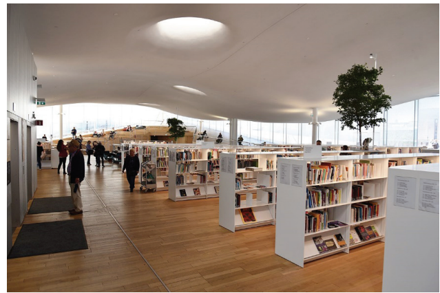
Fig. 7: Vista degli interni della Helsinki Central Library Oodi [Bahnfreund, 2019].

La Helsinki Central Library Oodi, progettata dal gruppo finlandese di ALA Architects 19 , localizzata nel quartiere Töölönlahti, è stata inaugurata nel 2018 e in essa possiamo vedere realizzata l'utopia congiunta della 'pubblicità' benefica della public library e della socialità,