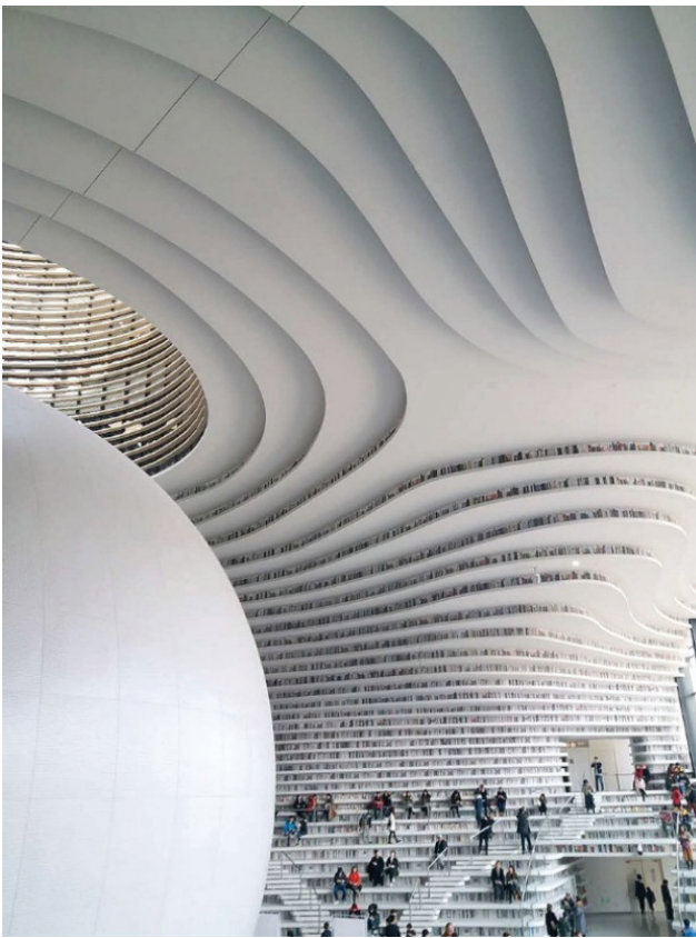
Fig. 6: Scaffali della biblioteca di Tinajin [Muzzleflash, 2017].

e innestato in una tradizione culturale completamente diversa da quella europea. Quella di Tianjin è dunque una utopia concreta con evidenti tracce distopiche, in cui lo sguardo è privato di un contesto estetico e cognitivo del quale le biblioteche barocche potevano avvalersi, e che si fondava sulla infrastruttura, condivisa tra le élite intellettuali della Repubblica delle lettere, alimentati dall'ermetismo postrinascimentale, dal pensiero di Raimondo Lullo e soprattutto dal versante esoterico, alchemico e cabalistico delle arti della memoria, che perseguivano l'utopia decisamente non materializzabile di stabilire una biunivoca identità tra il contenuto della mente del fruitore dei Theatri della memoria e i contenuti della conoscenza che nei Theatri stessi venivano organizzati, disposti, resi visibili 18 .