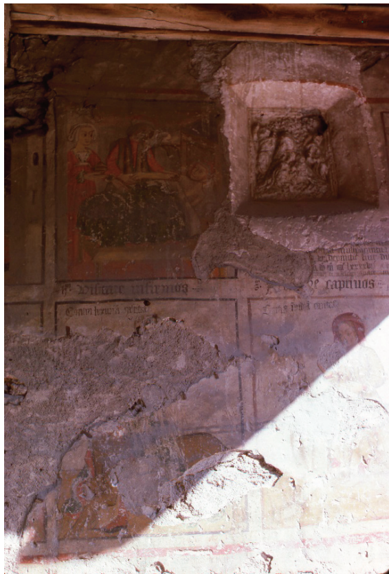
Figura 4. Particolari degli affreschi sulla facciata sud dell'ospizio di Leverogne.

Oltre alle scene descritte nella didascalia dell'immagine 3, nel registro superiore si trova la nicchia in cui è stato inserito il bassorilievo in stucco raffigurante la Madonna con Bambino. Sotto si legge: «Depinctum fuit die (...) anno Domini MCCCCLXXXVII et post (...) requiescat in pace. Amen». La didascalia Redimere captivos , situata sotto il bassorilievo, non trova corrispondenza nelle immagini (questa scena è stata raffigurata nel riquadro a destra della nicchia, non visibile in questa fotografia). Nel registro inferiore una donna con abito giallo e copricapo rosso è rappresentata in groppa a un animale incatenato (sono visibili le corna). La scena è introdotta dalla massima Contra invidiam caritas (su concessione della Regione autonoma Valle d'Aosta).