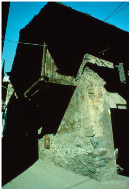
Figura 1. L'ospizio di Leverogne, facciate sud ed est con affreschi.