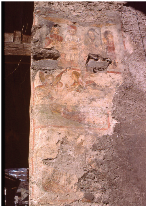
Figura 2. Gli affreschi sulla facciata est dell'ospizio di Leverogne.

Nel registro mediano è rappresentato il Transitus animae . Qui, su uno sfondo verde, un corpo privo di vita, forse di un santo (presenza dell'aureola), appare disteso con le mani giunte in atto di preghiera; sopra di lui l'anima è portata verso l'alto da due figure angeliche alate. Nel registro superiore è raffigurata una mensa imbandita con tre commensali; una quarta persona si affaccia sulla scena da una porta che si apre sulla destra. Tutti i riquadri, compreso quello del registro inferiore, non più leggibile, sono contornati da una cornice rossa.