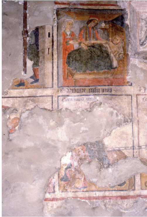
Figura 3. Particolari degli affreschi sulla facciata sud dell'ospizio di Leverogne.

Nel registro superiore la didascalia Visitare infirmos illustra la scena in cui si distingue un ammalato disteso nel letto e assistito da un uomo, si direbbe un medico che ne tasta il braccio, e da una donna che porge un vaso, probabilmente contenente dei medicinali. Nel registro inferiore si intravedono il corpo di un animale incatenato (ben visibile uno zoccolo, presumibilmente di caprone) e busto e gambe di una figura umana (si distingue una scarpetta nera con calza rossa) che si trova sulla sua groppa. La scena è introdotta dalla didascalia Contra luxuriam castitas.