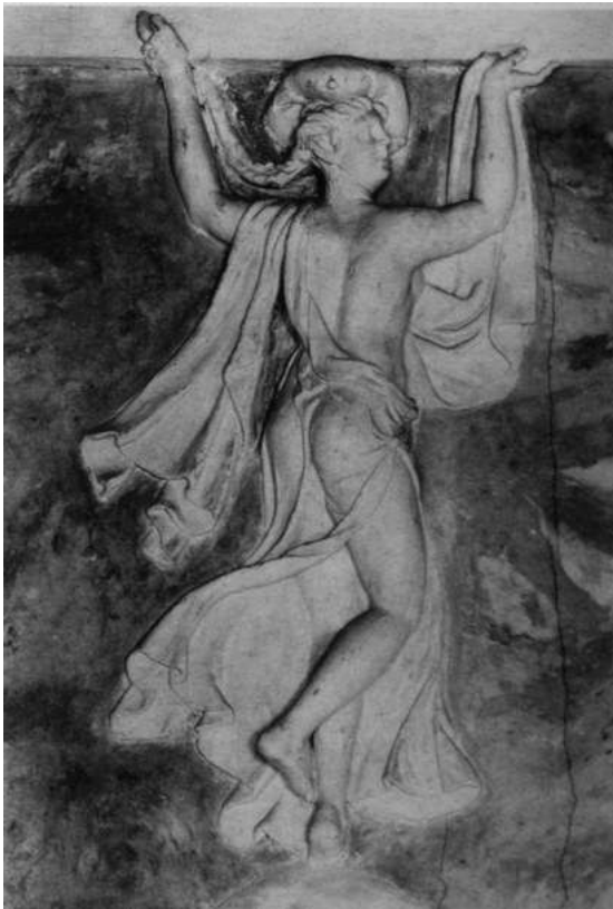
12. Collaboratori di Giulio Romano, Cariatide , 1527-1539, Mantova, palazzo Te, camera delle Cariatidi