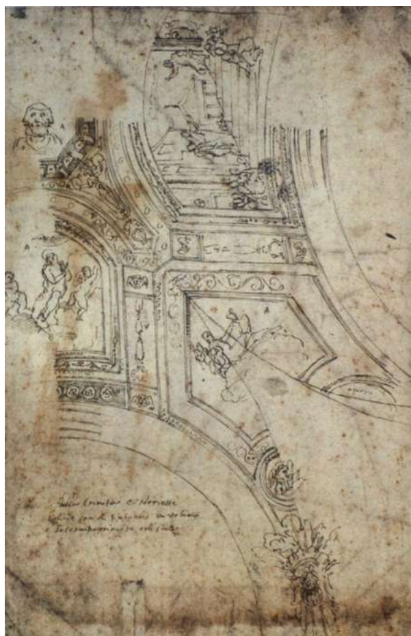
17. Anonimo del XVIII sec., Copia dalla volta della cappella Massimo , Waddesdon Manor, Rothschild Collection, inv. 1820