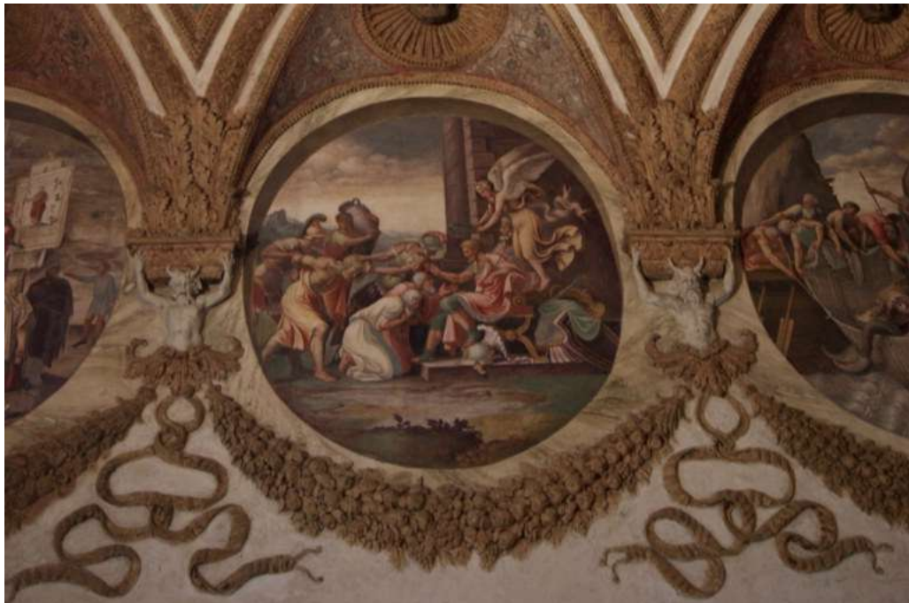
4. Collaboratori di Giulio Romano, 1527-1528, Mantova, palazzo Te, camera dei Venti, part.