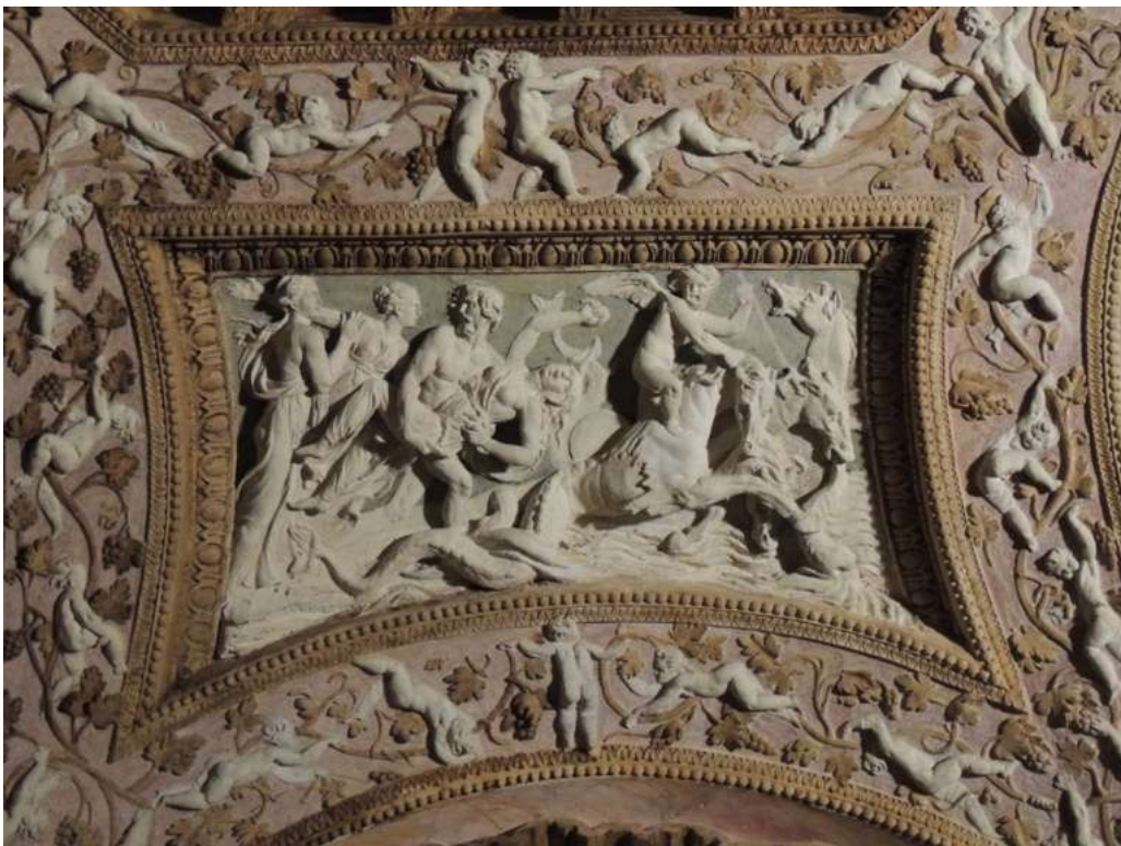
14. Rosso Fiorentino, Francesco Primaticcio e collaboratori, 1533-1539, Fontainebleau, castello di Fontainebleau, galleria di Francesco I, part.