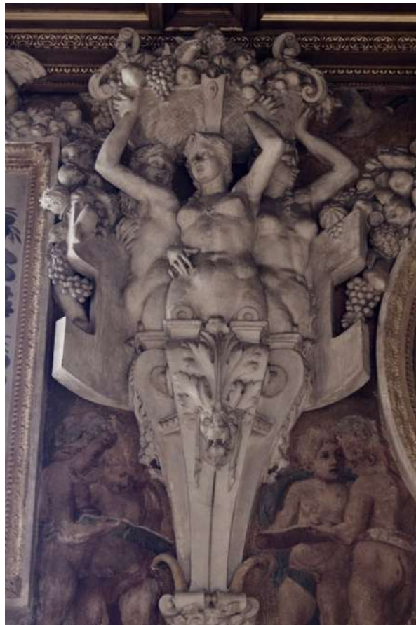
10. Raffaello e collaboratori, 1517-1519, Città del Vaticano, Palazzi Apostolici, loggia di Leone X, part.