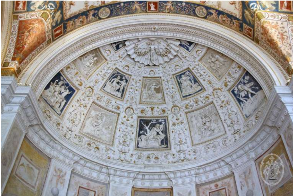
1. Giulio Romano, Giovanni da Udine e collaboratori, 1520-1523, Roma, villa Madama, loggia, part.