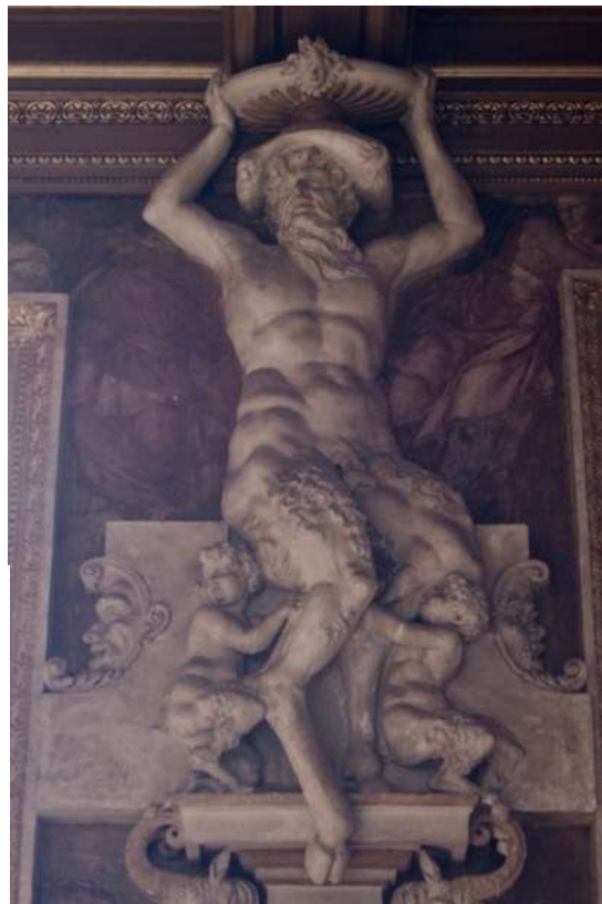
13. Rosso Fiorentino, Francesco Primaticcio e collaboratori, Satiro , 1533-1539, Fontainebleau, castello di Fontainebleau, galleria di Francesco I