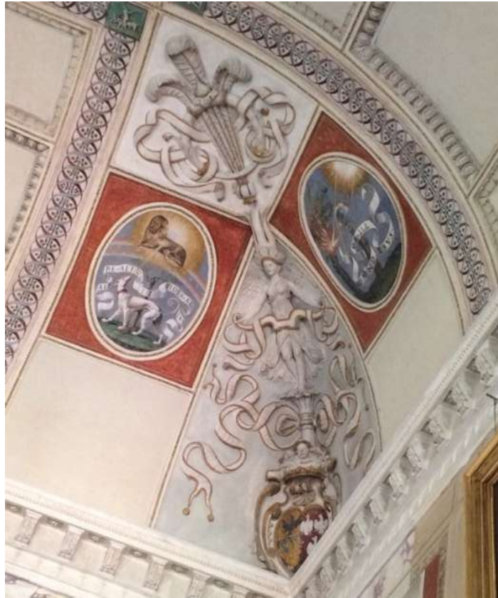
3. Giulio Romano e collaboratori, 1520-1524, Roma, villa Lante, salone, part.