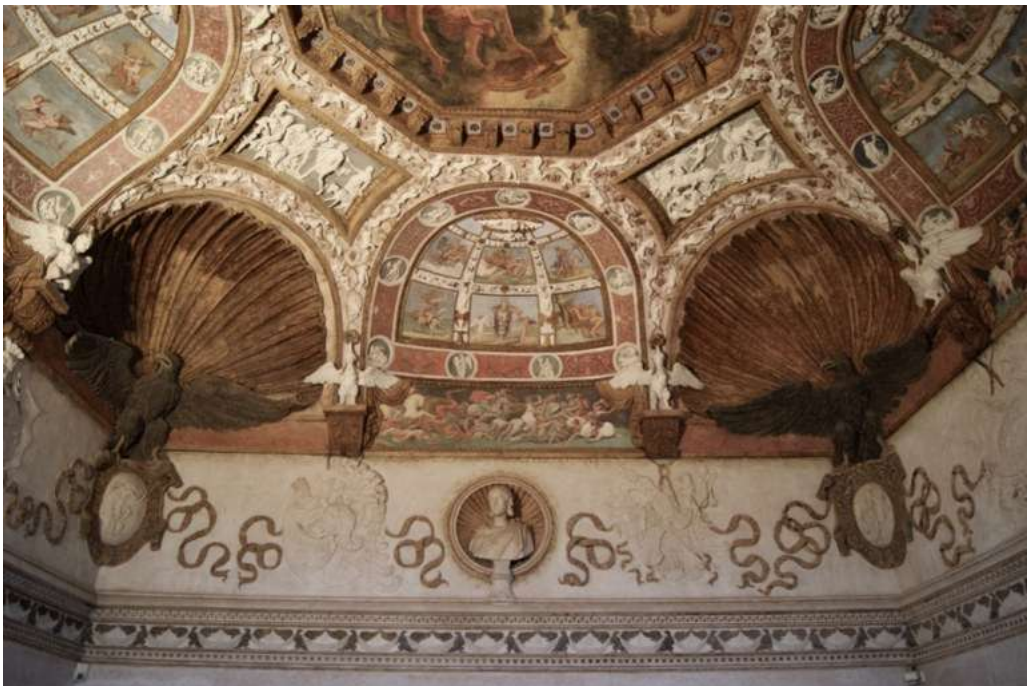
2. Francesco Primaticcio e collaboratori di Giulio Romano, 1527-1528, Mantova, palazzo Te, camera delle Aquile