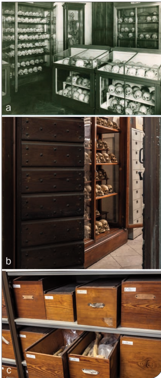
Fig. 1. a) La collezione osteologica ordinata in una sala al piano rialzato dell'allora Istituto di Anatomia Umana Normale (1961); b) parte della collezione craniologica collocata in armadi di fine Ottocento in locali di deposito del Museo di Anatomia prima del riordino; c) cassette lignee contenenti la collezione di scheletri postcraniali.

riordinata in una stanza a essa dedicata (fig. 1a). Agli inizi degli anni Ottanta fu realizzato un riordino (Giraudi et al., 1984) che permise l'identificazione dei reperti in base a quanto riportato sui registri d'epoca conservati nell'Archivio storico dell'Istituto di Anatomia umana. Quando disponibili, furono riportati sul frontale dati relativi a età e sesso dell'individuo. I reperti furono disposti negli armadi originali in loca-