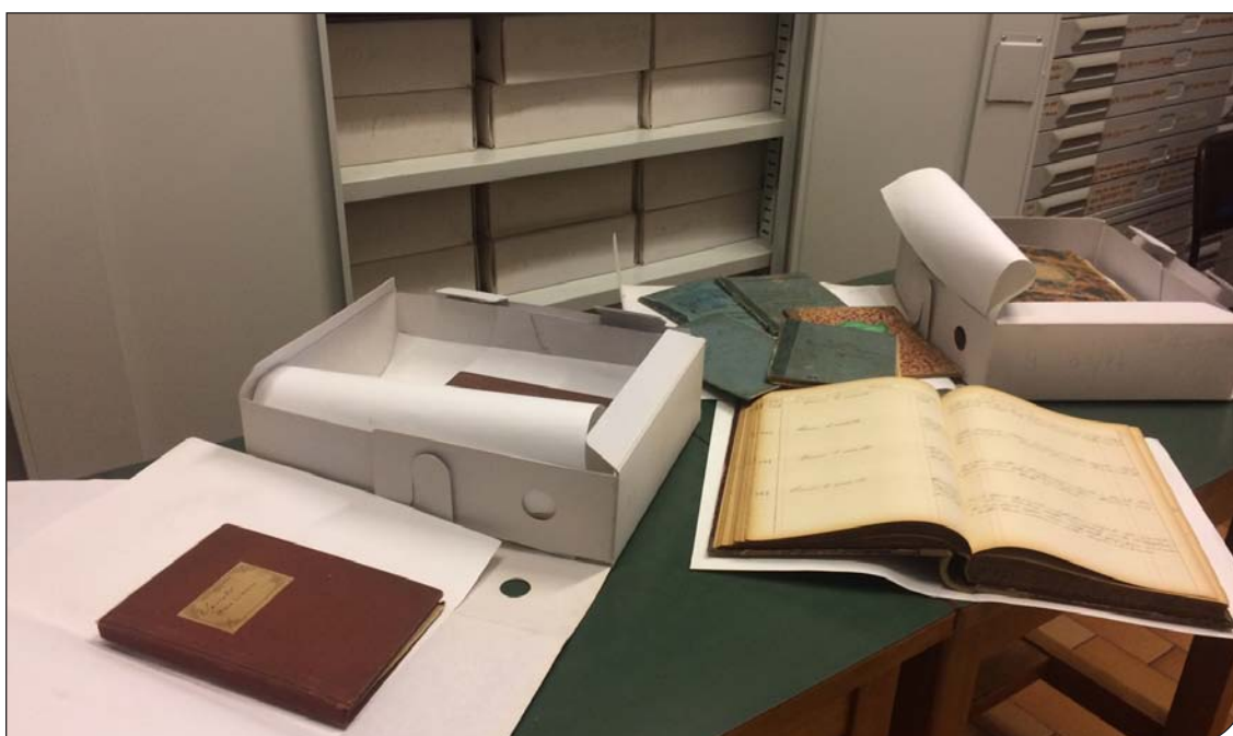
Fig. 5. Archivio storico dell'Istituto di Anatomia umana (fondo IT SMAUT IAU) con i numerosi quaderni “inventari” che riguardano la collezione osteologica.