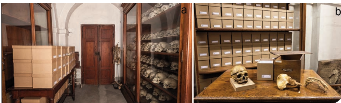
Fig. 4. a) Riordino della collezione craniologica: fase di sistemazione dei crani in singole scatole di cartone; b) esempio di ricongiungimento tra cranio e scheletro post craniale di uno stesso individuo ottenuto grazie alla consultazione dei registri.