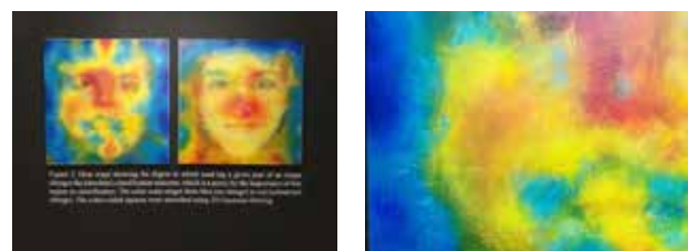
Figura 3: Tercera desprogramación material: óleo y densidad. Cortesía del artista Felipe Rivas San Martín

Luego sigue un díptico pictórico que traduce intersemióticamente el mapa de calor de la rostreadad sexualizada. En el estudio de Stanford la facialidad se transparenta por medio de una prueba de substracción de datos. Para individualizar las geografías faciales sensibles a la lectura de la orientación sexual, Kosinski y Wang experimentan la eficacia del reconocimiento de la red neuronal al reificar el rostro artificial. Por medio de un proceso de abstracción, durante los experimentos se cancelan zonas del rostro y, a partir de esas borraduras, se averigua la eficacia de visión e interpretación de la red neuronal. Rivas, entonces, recupera esos mapas y opaca la geografía facial por medio de pinturas al óleo que vuelven densas y espesas ciertas partes del rostro determinantes para la identificación de la orientación sexual (Figura 3).