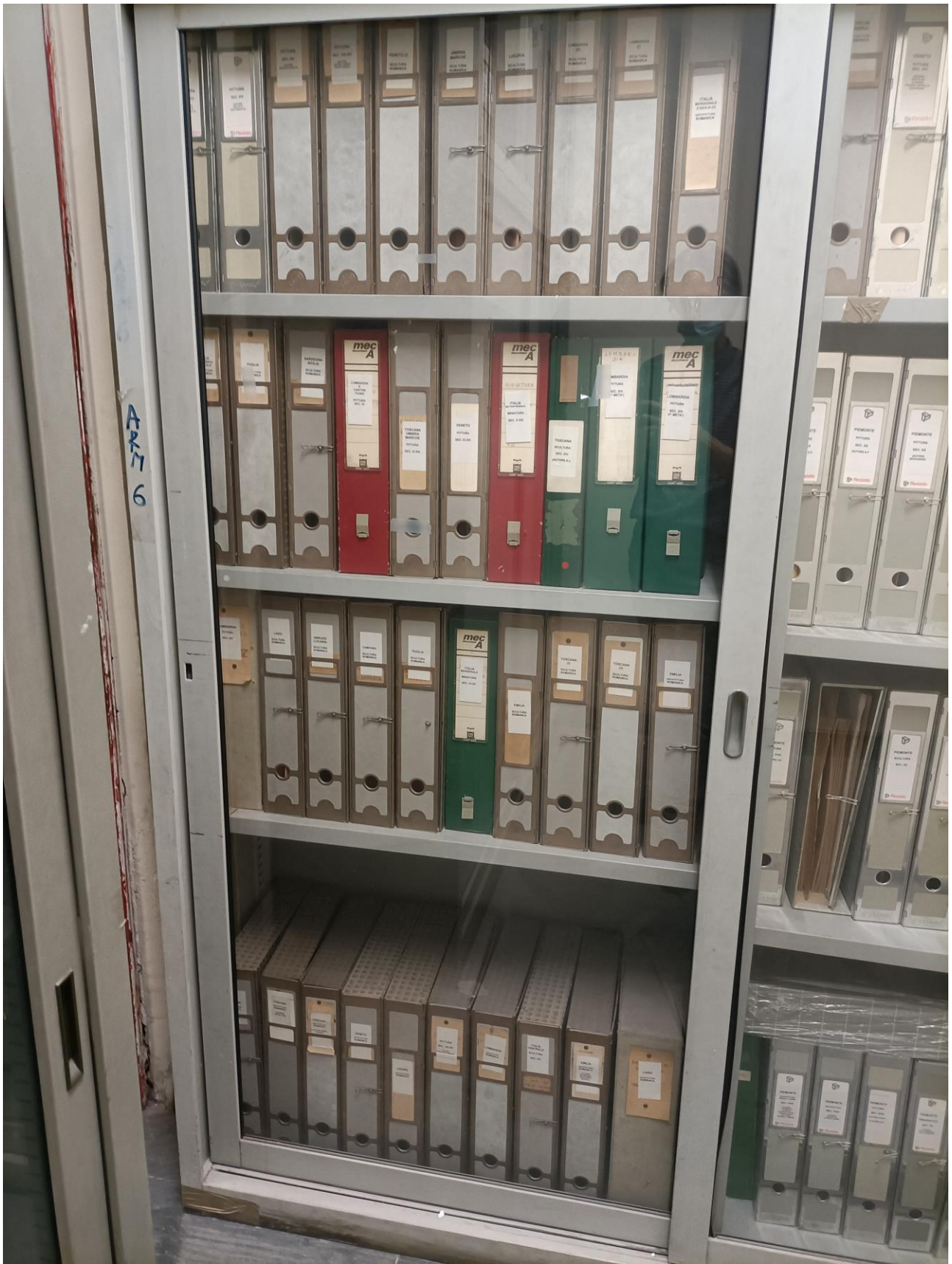
Fig. 6 – Armadi della Fototeca - Biblioteca di Arte Musica e Spettacolo, raccoglitori organizzati per area geografica delle opere fotografate