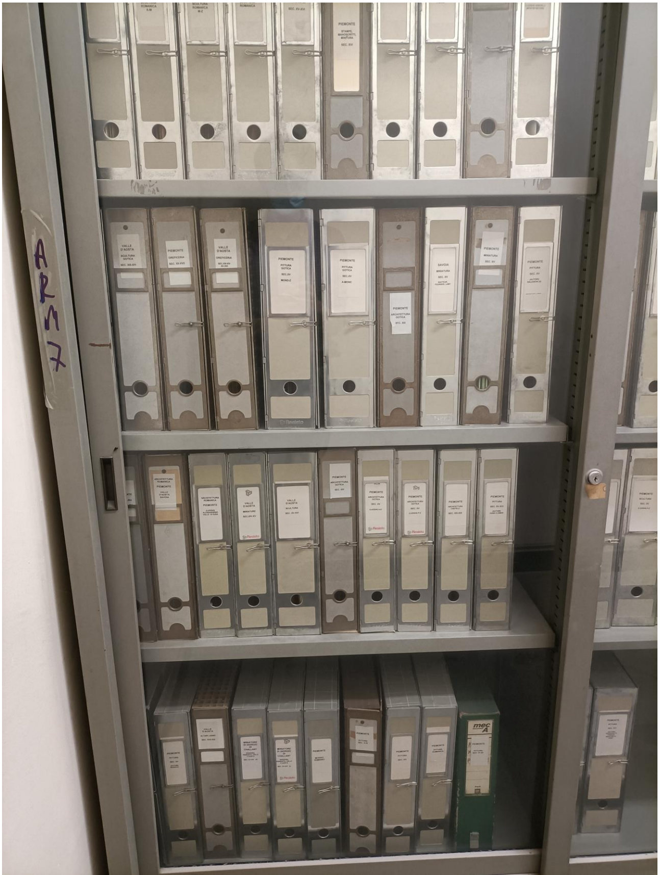
Fig. 5 – Armadi della Fototeca - Biblioteca di Arte Musica e Spettacolo, raccoglitori organizzati per area geografica delle opere fotografate