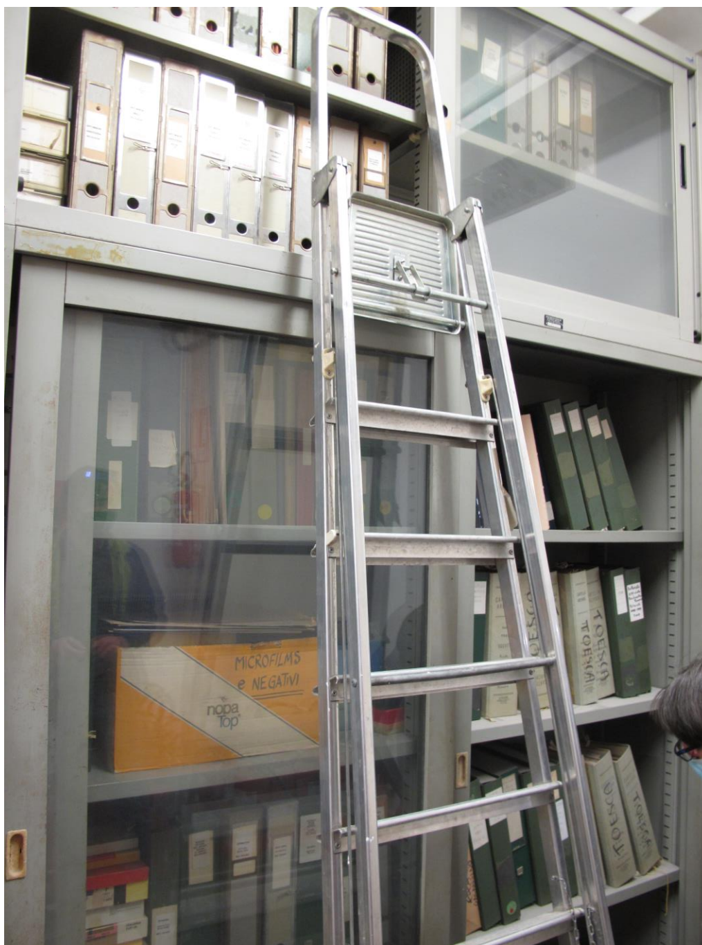
Fig. 2 – Armadi della Fototeca - Biblioteca di Arte Musica e Spettacolo, gruppo di faldoni relativi alle acquisizioni operate da Pietro Toesca

professor Toesca di Storia dell'Arte conobbi la riproduzione del quadro pompeiano in cui Medea assiste all'uccisione dei figli avuti da Giasone; assiste con gli occhi bendati e mi pare di ricordare che il Toesca dicesse che questo era un modo di esprimersi degli antichi [...]» (missiva alla cognata Tatiana datata 20 settembre 1931) –. L'istituzione della prima cattedra di Storia dell'arte nell'ateneo torinese determinò la nascita contestuale del Gabinetto di Storia dell'Arte, in breve divenuto Istituto di Storia dell'Arte della Facoltà di Lettere, il cui sviluppo documentale fu largamente debitore dell'acquisizione da parte di Toesca ( fig. 2 ) di diapositivi e di immagini fotografiche, fondamentale strumenti all'attività didattica, in misura non irrilevante di provenienza Anderson, Brogi, Danesi.