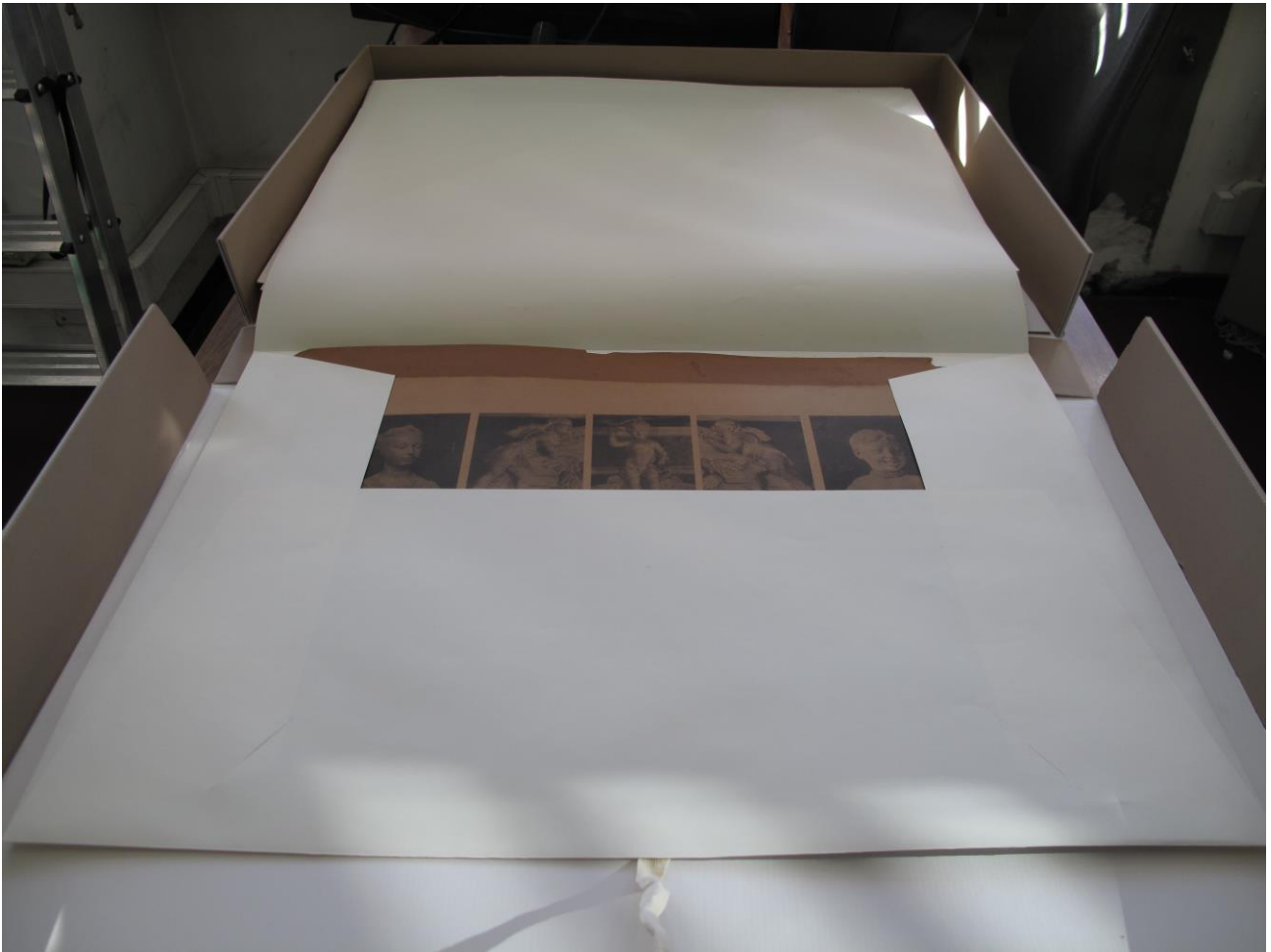
Fig. 8 – Cartella di carta da archivio acidfree impiegata per la conservazione ordinaria delle fotografie del nucleo originale catalogato della Fototeca costituito negli anni di docenza di Pietro Toesca

Tali stampe fotografiche ( figg. 9-10 ) sono state oggetto di digitalizzazione su DVD. Il contenuto, conservato anche nel drive della Biblioteca di Arte Musica e Spettacolo, è visualizzabile su specifica richiesta indirizzata alla stessa Biblioteca ( biblio.dams@unito.it ).