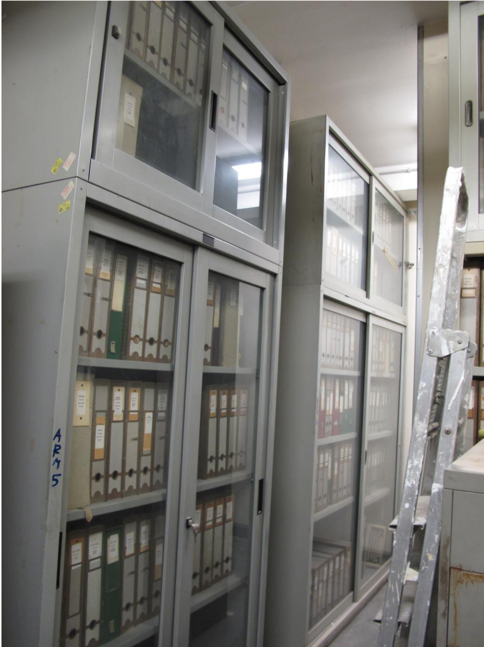
Fig. 1 – Armadi della Fototeca - Biblioteca di Arte Musica e Spettacolo

Parte della Biblioteca di Arte, Musica e Spettacolo del Dipartimento di Studi Umanistici dell'Università degli Studi di Torino (codice ISIL: IT-TO0643), la Fototeca - Biblioteca di Arte Musica e Spettacolo ( fig. 1 ) afferisce al Dipartimento di Studi Umanistici.