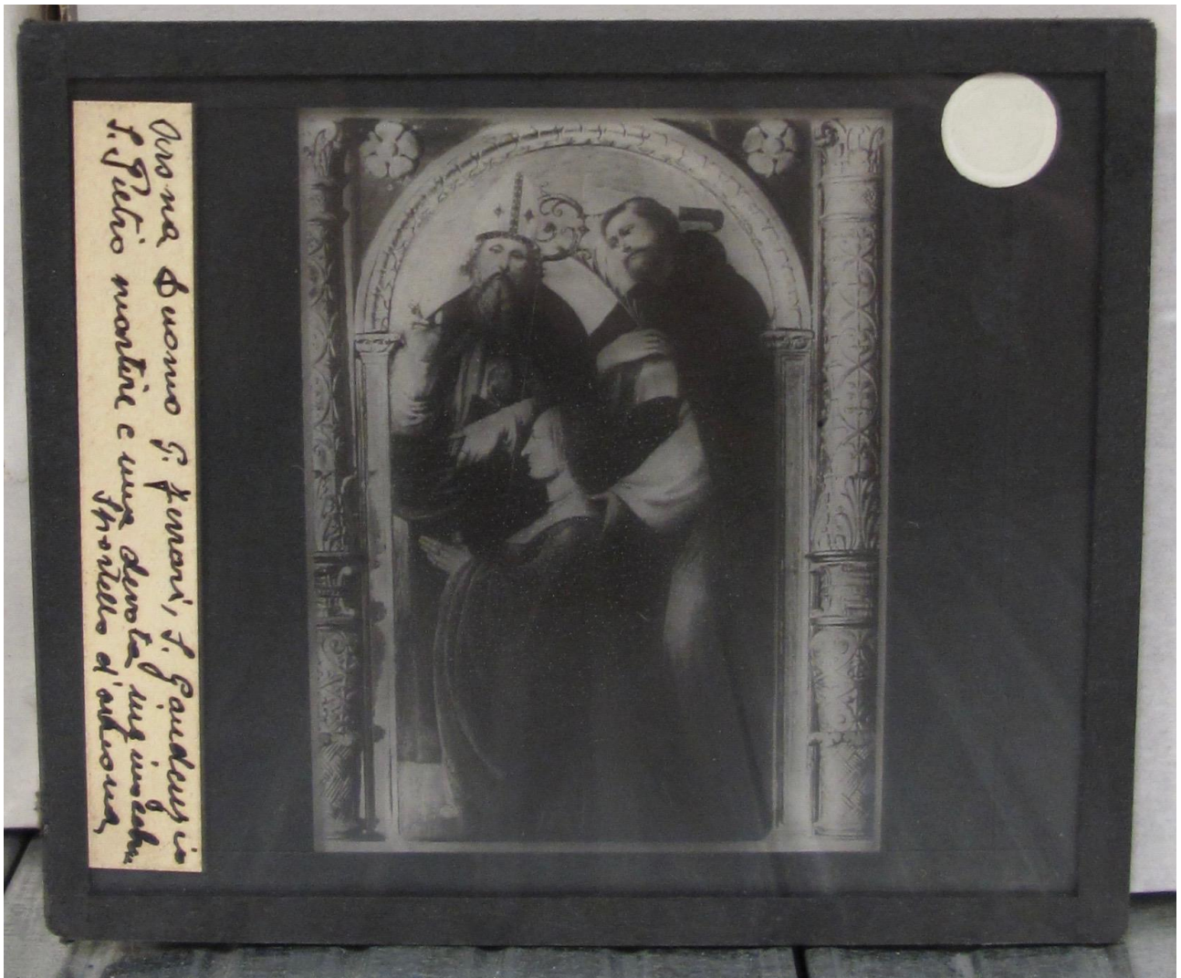
Fig. 4 – Esempio di negativo in vetro (10 cm x 8,5 cm)

Priva in larga misura di inventariazione, dunque difficilmente precisabile nella sua esatta estensione numerica, la raccolta si compone di molteplici tipologie documentali, immagini fotografiche (circa 15000), negativi in vetro (circa 8000; fig. 4 ), diapositive (circa 7000), microfilms, che presentano un ordinamento presieduto da criteri essenzialmente riconducibili ad area geografica, cronologia, tipologia, tecnica esecutiva, scuola e autore ( figg. 5-6 ).