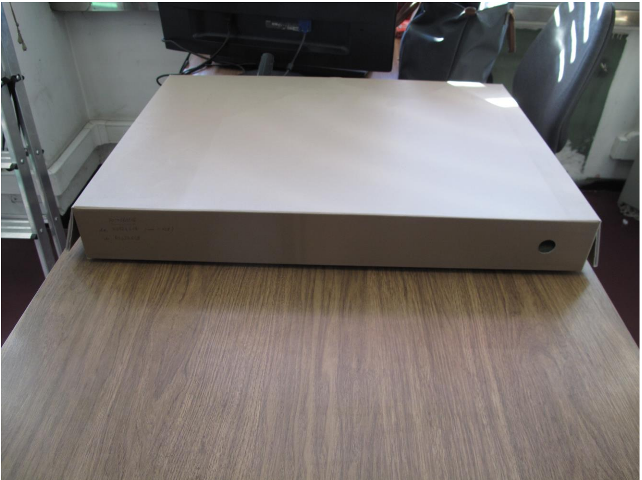
Fig. 7 – Contenitore di cartone antiacido per la conservazione ordinaria delle fotografie del nucleo originale catalogato della Fototeca costituito negli anni di docenza di Pietro Toesca

Oltre 100 stampe fotografiche realizzate prevalentemente con la tecnica dei sali d'argento, a rappresentare probabilmente il nucleo più antico della Fototeca corrispondente a un acquisto operato da Toesca al principio della sua docenza (1908-1909), sono state studiate e catalogate secondo lo standard della scheda F in occasione di una tesi di laurea in Biblioteconomia discussa nell'a.a. 2008-2009 (candidata Viola Agata Lanza, relatore prof. Maurizio Vivarelli). Attualmente sono riunite, ciascuna singolarmente custodita in una cartella di carta da archivio acidfree , in quattro contenitori di cartone antiacido per lunga conservazione, appositamente realizzati (figg. 7-8).