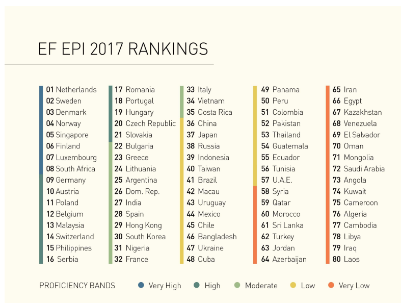
Fig. 1:

L'indice di conoscenza dell'inglese EF 4 per l'anno 2017 vede l'Italia alla posizione N. 33 della sua classifica, nel gruppo di paesi classificati come aventi un livello di competenza nella lingua inglese "moderato". Tuttavia, è da notare che l'Italia compare in fondo a questo gruppo (seguita solo dal Vietnam e dalla Costa Rica, appena prima che cominci il gruppo con livello di competenza "basso"). Di conseguenza, è plausibile presumere che non sia molto realistico immaginare che il fedele italiano medio, e particolarmente le masse di devoti italiani che assistono alle omelie del papa, non avrebbero problemi a comprendere le sue parole.