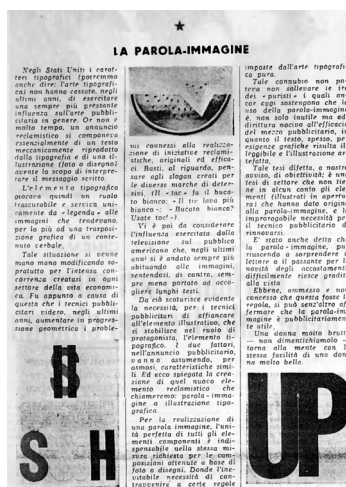
«La parola-immagine», GDS 32, 5 settembre 1959: 2.