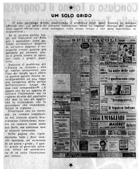
«Un solo grido» possibile nel marasma dei flani, GDS 37 , 10 ottobre 1959: 2.

L'una contro l'altra armate, una pletera di inserzioni cercano di sopraffarsi in una ridda di caratteri positivi o negativi, tipografici o disegnati (di cui molti di difficile lettura se non illeggibili). Ci sono perfino doppie inserzioni [...]. Se poi cerchiamo di orientarci con la lettura ecco il solito repertorio di logori richiami, cui nessuno dà più credito: un film colossale – repliche trionfali – grande prima – successo incondizionato – un film sensazionale – un film di cui tutti parlano – un capolavoro – eccezionale successo – entusiasmantissimi repliche... 14 .