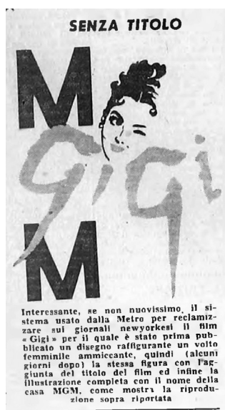
Gigi (V. Minnelli, 1958), GDS 9, 7 marzo 1959: 2.