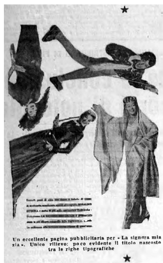
La signora mia zia ( Auntie Mame , M. Da Costa, 1958), GDS 9, 7 marzo 1959: 2.

in settimana, o di I bucanieri ( The Buccaneer , A. Quinn, 1958) che gioca con una «idea semplice ed efficace per creare l'attesa» 19 : mostrare, su tre numeri consecutivi di una rivista, un'inserzione raffigurante vascelli dei pirati a ogni numero più vicini.