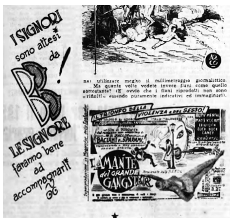
Fig. 2. Il mantra è contro i continui riferimenti sessuali e macabri, GDS 1, 10 gennaio 1959: 2.

Sul piano linguistico, l'attacco verte sulla sintassi, sull'uso del gergo e sulla «routine e assoluta mancanza d'inventiva» degli slogan; il mantra è contro i continui riferimenti sessuali e macabri, e contro la retorica del «rigorosamente vietato» usato a fini promozionali, laddove pare che «oggi non esistano più film vietati, ma solo rigorosamente vietati» 15 . Per contrastare la mala redazione dei testi pubblicitari, la rubrica propone ripetuti interventi: essi devono «farsi leggere, farsi vedere» ed «essere comprensibili e credibili» senza scadere nella magniloquenza né, peggio, nella falsità: «numerosi esempi hanno dimostrato chiaramente [...] che un falso annuncio pubblicitario, cinematografico e non, si arreca danno e si smentisce da sé» 16 . Quanto all'uso degli aggettivi, a più riprese compaiono riferimenti ai messaggi subliminali (è del 1957 la prima pubblicazione di The Hidden Persuaders di Vance Packard), scoraggiandone l'uso 17 .