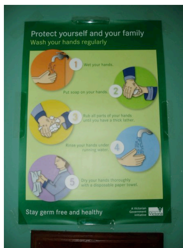
Fig. 4: Istruzioni per lavarsi le mani

Esco fuori dal cubicolo dopo aver seguito quasi tutte le istruzioni, e trovo un altro poster, sempre di fattura governativa, che m'insegna come lavarmi le mani (fig. 4):