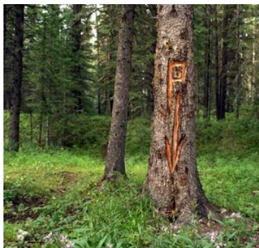
Fig. 2: 'Peeing tree' canadese

La certezza di un luogo adibito a toilette. La difficoltà di depositare i rifiuti del mio corpo in un luogo che la cultura non abbia designato per tale scopo. Il senso di libertà che mi deriva dall'osservare questi uomini cambogiani. Il senso della mia stupidità. La toilette come luogo che esprime l'irregimentazione del corpo moderno. La paradossalità del 'peeing tree' dei campeggi canadesi (fig. 2): tale è l'abitudine di circoscrivere un luogo per l'eliminazione dei rifiuti corporali che è impossibile scegliere un albero a caso. È necessario trasformarlo in una toilette. Non è vero che le toilette sono non-luoghi. I limiti del mio senso del luogo.