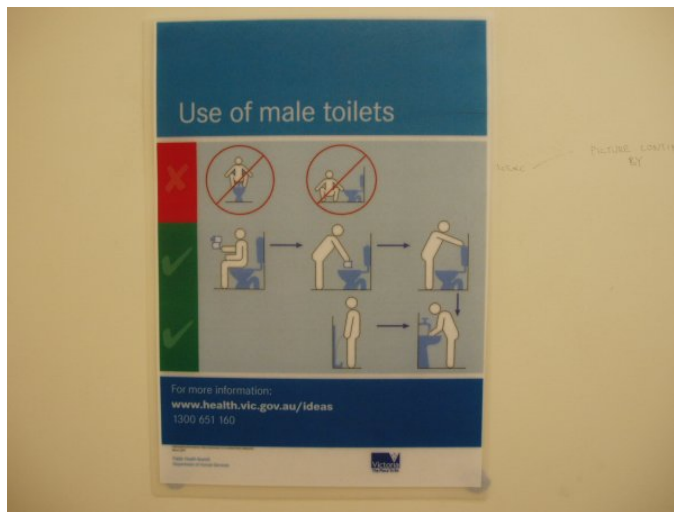
Fig. 3: 'Use of male toilets'

È stato ideato dal governo dello stato del Victoria, Australia. Dovrebbe insegnare l'uso corretto delle toilette maschili attraverso una stilizzazione grafica simile a quella della segnaletica stradale. Sotto il titolo, "Use of male toilets", sono rappresentati due modi sbagliati di utilizzare le toilette maschili. Su entrambi è sovrimposto il segnale stradale di divieto. Accanto campeggia una croce rossa. Ecco come interpreto i grafici: non si deve defecare accovacciati con i piedi sulla tazza del WC; non si deve defecare accovacciati per terra accanto al WC. Invece, come mostra l'algoritmo appena più in basso, bisogna defecare seduti sul WC, poi pulirsi con la carta igienica, poi gettare la carta igienica nel WC, poi tirare lo sciacquone, e infine lavarsi le mani. Bisogna lavarsi le mani anche dopo aver orinato.