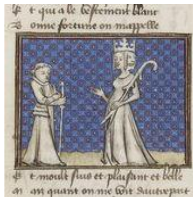
Fig. 1: Ms. français 829, Paris, Bibliothèque nationale de France, contenente il Pèlerinage de vie humaine di Guillaume de Digulleville, 1390 ca.

Fortuna con ruota è la sintesi di una lunga serie di trasformazioni di originari riti sacrali pre-ellenici legati alla regalità e al rinnovamento stagionale, assorbiti nella mitologia ellenica dalla dea Tyche (il caso) e dalla dea Nemesis (la giusta vendetta), poi acquisite nella mitologia romana come Fortuna (positiva) e Sors (negativa), fino appunto, all'unificazione in un'unica entità doppia ( fortuna è, difatti, una vox media ) ora benevola, ora crudele, e pertanto raffigurabile anche bifronte (fig. 1) 22 .