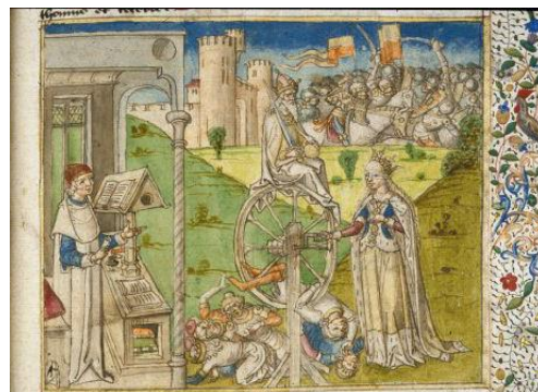
Fig. 4: Ms. Harley 621, London, British Library, contenente il De casibus virorum illustrium di Giovanni Boccaccio nella traduzione francese di Laurent de Premierfait, terzo quarto sec. XV.