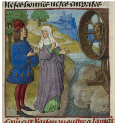
Fig. 3: Ms. Harley 4425, London, British Library, contenente il Roman de la Rose , 1490-1500 ca.