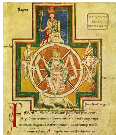
Fig. 2: Codex Latinus Monacensis 4550, München, Bayerische Staats-Bibliothek, contenente i Carmina burana , sec. XIII.

Il simbolo della ruota determina un’ampia gamma di variazioni iconografiche e iconologiche, relative sia alla posizione di Fortuna rispetto ad essa, sia al numero e alla tipologia di persone che ruotano su di essa: ad esempio, Fortuna imperatrix può fungere da perno della ruota, come anche nel Roman de la Rose , v. 5899: « et siet el milieu comme avugle » (figg. 2 e 3), o stare accanto alla ruota, azionandola, talvolta con l’ausilio di una manovella (fig. 4); la permutazione più frequentemente attestata è quella di quattro figure umane in altrettanti stadi di salita al potere e caduta, scandita in senso orario dai motti regnabo – regno (una figura regale in trono, al colmo della parabola ascendente) – regnavi – sum sine regno (una figura nuda e distesa, al punto più basso della parabola discendente; fig. 5) 24 .