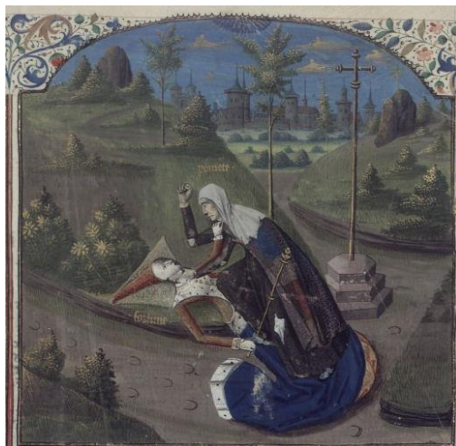
Fig. 6: Ms. français 233, Paris, Bibliothèque nationale de France, contenente il De casibus virorum illustrium di Giovanni Boccaccio, nella traduzione francese di Laurent de Premierfait, seconda metà sec. XV.

Rilevo, per inciso, che l'antitesi tra buona e mala sorte, condensata qui metonimicamente negli effetti opposti che essa produce, la ricchezza e la povertà, e sottoposta nel corso del Rinascimento al già menzionato processo di emblemizzazione, sfocia – nel De casibus di Boccaccio (III, 1) – in un vero e proprio scontro ( certamen ) di Povertà versus Fortuna (fig. 6), segno da un lato della marcata connotazione negativa di Fortuna-nemica, dall'altro della produttività del filone letterario allegorico delle psicomachie e delle giostre di virtù e vizi.