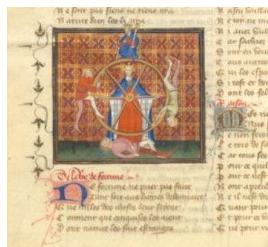
Fig. 5: Ms. français 380, Paris, Bibliothèque nationale de France, contenente il Roman de la Rose , fine sec. XIV.

Questa ricchezza di dettagli nella rappresentazione iconico-simbolica è tipica delle arti figurative; più semplificata è, invece, la descrizione letteraria, per quanto anche in essa la portata metaforica degli oggetti possa arrivare ad acquisire più importanza delle qualità intrinseche del soggetto: così, Adam de la Halle non designa Fortuna attraverso il nome,