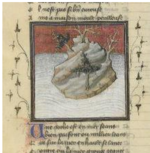
Fig. 7: Ms. français 12595, Paris, Bibliothèque nationale de France, contenente il Roman de la Rose , secc. XIV ex.-XV in.

imprevedibili del suo agire. Pertanto, l'isola rocciosa (fig. 7) ora quasi sommersa dai flutti, ora quasi sospesa nell'aria "si dissimula e si modifica continuamente" (v. 5931: « se desguise et se rechange ») come l'ambigua Fortuna, gli alberi del luogo "si trasformano" (v. 5959: « chascun arbre ainsi se defformen »), i due fiumi che li scorrono, l'uno tranquillo e accogliente, l'altro putrido e turbinoso, "si convertono" e convergono l'uno nell'altro (v. 6065: « li tresmue sa nature »); come la contraddittoria volontà di Fortuna, la casa è costruita in bilico "parte a monte e parte a valle" (v. 6089-90: « L'une partie... va contremont et l'autre avale »), da un lato ostenta meraviglie da reggia, dall'altro brutture da tugurio (vv. 6096 e 6102: « li mur d'or et d'argent »/« li mur de boen »); la padrona di casa si conforma all'ambiente, così che appare « comme une roynne » (v. 6119) quando frequenta le ricche sale, mentre "si spoglia e si priva" di ogni ornamento quando sta nelle stanze dissestate (vv. 6149: « Et si se desnue et desrobe »). Il ragionamento è, ancora una volta, costruito per opposizioni e, ovviamente, si prefigge di dimostrare – all'Amante e al lettore – la giustezza dei moniti di Ragione.