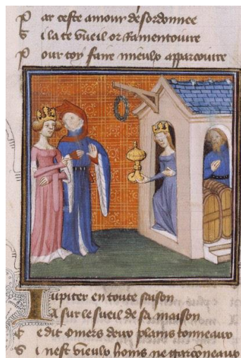
Fig.8: Ms. français 12595, Paris, Bibliothèque nationale de France, contenente il Roman de la Rose , secc. XIV ex.-XV in.

Fortuna taverniera (fig. 8) deriva, come da glossa esplicativa nel testo, da Omero ed è frutto di una contaminazione con attributi e funzioni tradizionalmente pertinenti a Zeus il quale, nel ventiquattresimo libro dell' Iliade , è descritto come il dispensatore dei beni e dei mali, contenuti in due botti collocate all'entrata del suo palazzo.