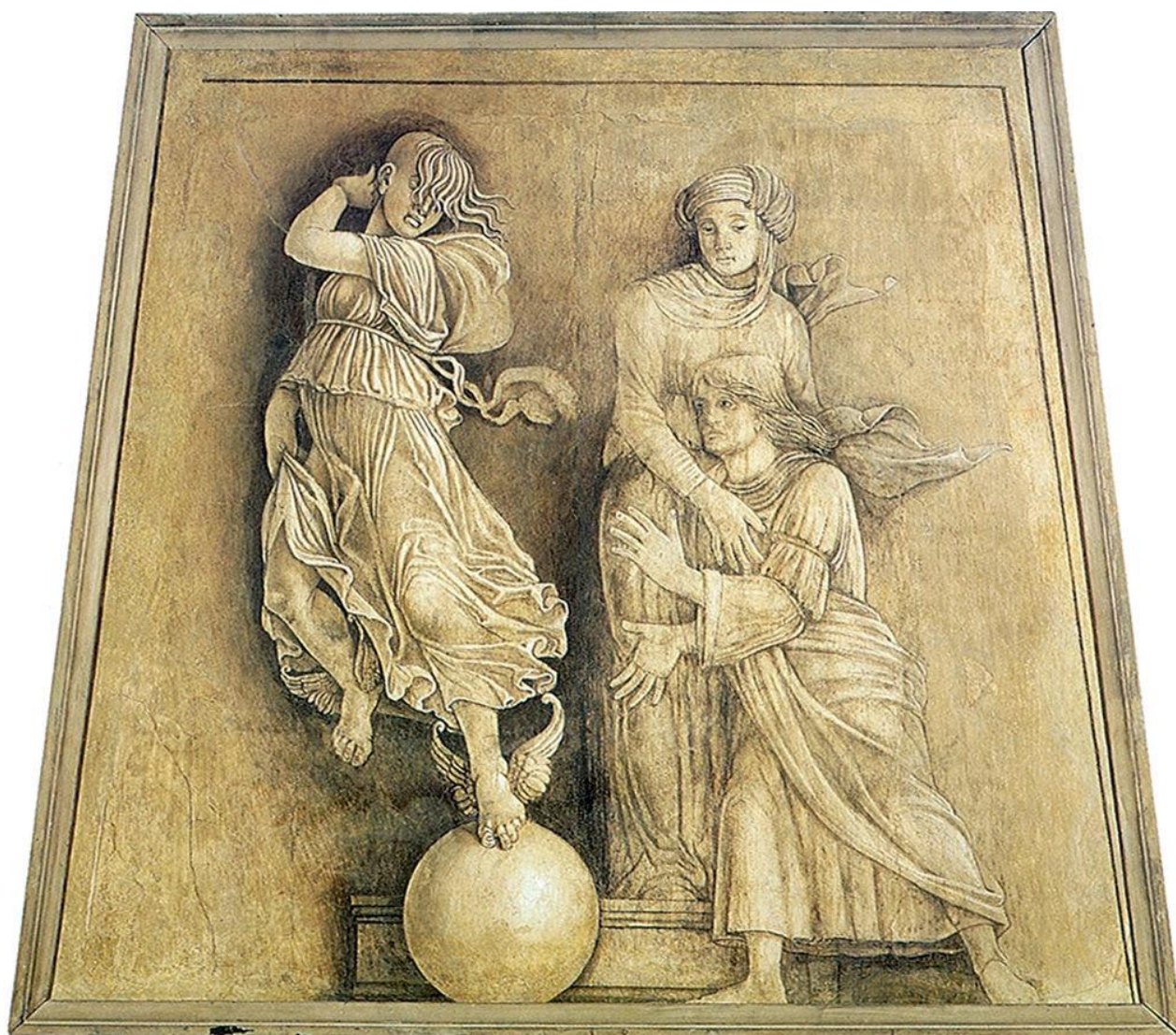
A. Mantegna, Occasio et Penitentia (Museo della Città di Palazzo San Sebastiano, Mantova)