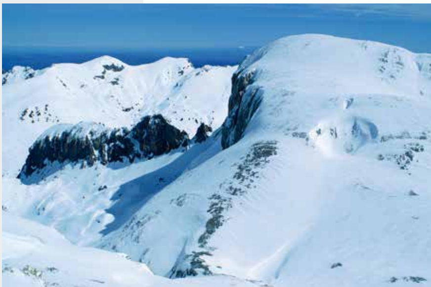
La cima delle Saline vista dal Cian Balaù. (Foto Bartolomeo Vigna).