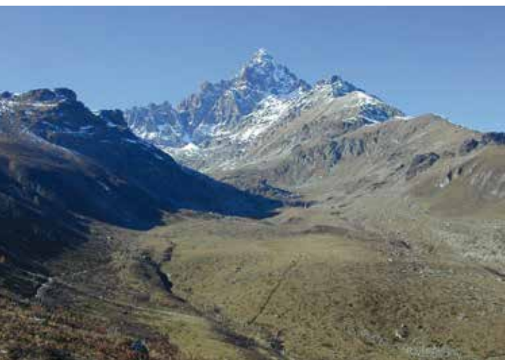
Il Monviso , in primo piano il Pian del Re, dove si raccolgono le acque della sorgente del Po.

La Dora Baltea, il fiume della Valle d'Aosta, è un bel fiume pieno di storia, scende da grandi montagne e sino a non molto tempo fa sgorgava dalla fronte di un ghiacciaio davvero immenso dalle parti di Ivrea. Ora entra in Po alla progressiva 147,4 e ha una lunghezza di 166,0 km dalla testata della Val Veny (col de la Seigne), e circa 152 km dalla sua confluenza col ramo della Val Ferret a Entreves (AIPO, Progetto PAI, 5403Dora_Baltea.pdf), entrambe sotto la mole del Monte Bianco.