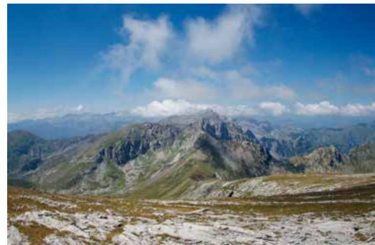
Vista dal Cian Ballà di punta Marguareis, dietro la quale c'è la zona Navela, e sulla destra la Conca delle Carsene. (Foto Giovanni Badino).

Qui siamo a circa 7,5 km dalla Sala delle Acque che