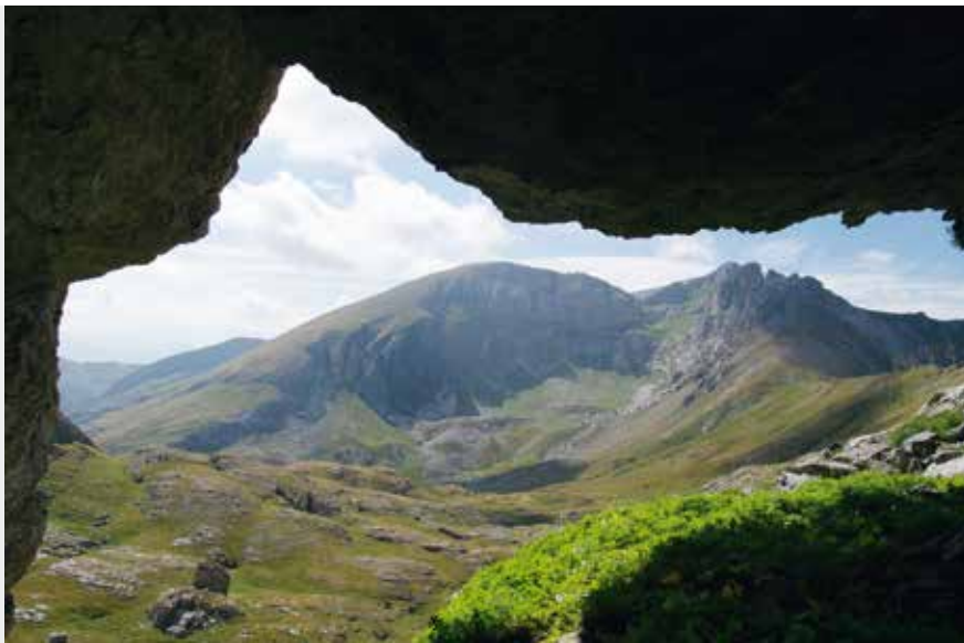
La conca di Piaggia Bella.

ad "aver pace co' seguaci suoi" in una lontana marina? Siamo alle sorgenti per quasi tutti, ma non per noi. Noi siamo speleologi, vale a dire "Quei Geografi che Esplorano i Fiumi a Monte delle Loro Sorgenti". Per i geografi un fiume inizia dalle sorgenti, ma per i Geografi del Sottosuolo li inizia solo la sua esibizione pubblica. Possiamo quindi proseguire, tuffandoci nella sorgente della Fus. Anzi no, tuffiamoci nel Garb d'la Fuz, che è più ampio. Risaliamo quindi la parete ombrosa sino al modesto ingresso del Garb, e immergiamoci nello specchio d'acqua da cui trabocca incessantemente l'acqua e alimenta la cascata.