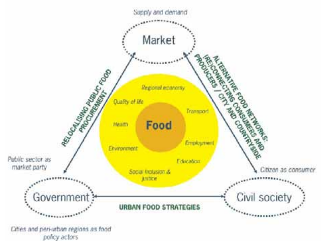
Figure 1 : La gouvernance alimentaire de la New Food Géographie