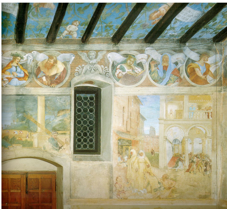
Fig. 2 – Lorenzo Lotto, Scene della vita di Santa Brigida , Cappella Suardi, Trescore (Bergamo)

Gli affreschi furono commissionati e ideati da Battista Suardi 17 , un umanista ossessionato dall'idea di una catastrofe imminente 18 , il quale, forse, volle prevenirla anche grazie all'intercessione di Santa Brigida, tradizionalmente invocata per la protezione contro la grandine. Nel 1524, infatti, un'inondazione devastò gran parte d'Europa, e molti la videro con angoscia, come un segno dell'ira di Dio per la diffusione del Luteranesimo. Il racconto visivo di una Santa in grado di esercitare il suo dominio sulla materia, sia riunendo quello che era stato frammentato (il calice rotto), sia dividendo ciò che era stato unitario (il bicchiere tripartito) 19 aveva probabilmente lo scopo di placare una comunità spaventata, rassicurandola a proposito del dominio della trascendenza sulla materia e sugli elementi. In una lettura più raffinata, l'affresco potrebbe anche fare riferimento alla miracolosa compresenza di tripartizione nell'unità e di unità nella tripartizione che è essenziale nel dogma cristiano della Trinità e soprattutto nella teologia di San Patrizio, un santo che le fonti agiografiche frequentemente associano a Santa Brigida 20 .