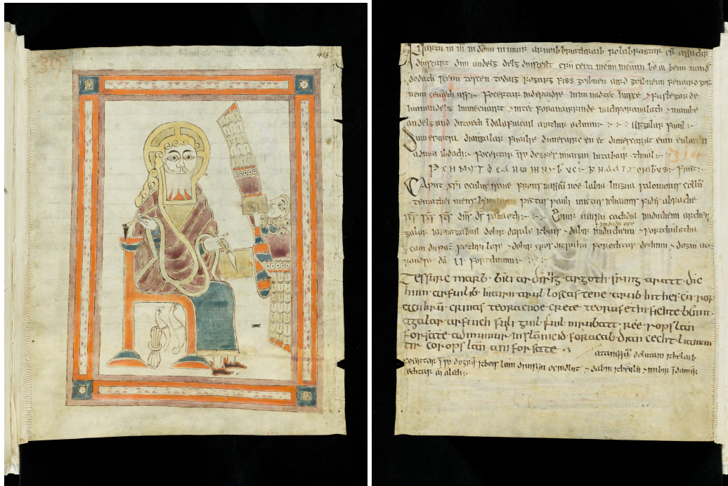
Figg. 4-5 - Cod. Sang. 1395

Un passaggio interessante tra i due mondi è forse rappresentato dal folio 418-9 del manoscritto 1395 della biblioteca dell'Abbazia di San Gallo (Cod. Sang. 1395), risalente all'8° secolo. Mentre il folio 418, sul recto (Fig. 4) mostra una bella miniatura irlandese raffigurante San Giovanni che scrive il libro dell'Apocalisse, il foglio 419 (Fig. 5), sul verso, contiene alcune formule magiche in gaelico, una delle quali è stata decifrata da Johann Kaspar Zeuss nella sua Grammatica Celtica 25 come un incantesimo di guarigione indirizzato a una guaritrice mitica, membro di una tribù di guaritori, Dian-Cecht, la quale comprendeva anche Dagda, il padre di Brigit: “admuinur in slánicid foracab Dian Cecht lia muntir”, “Vorrei l'unguento che Dian-Cecht ha lasciato al suo popolo” 26 .