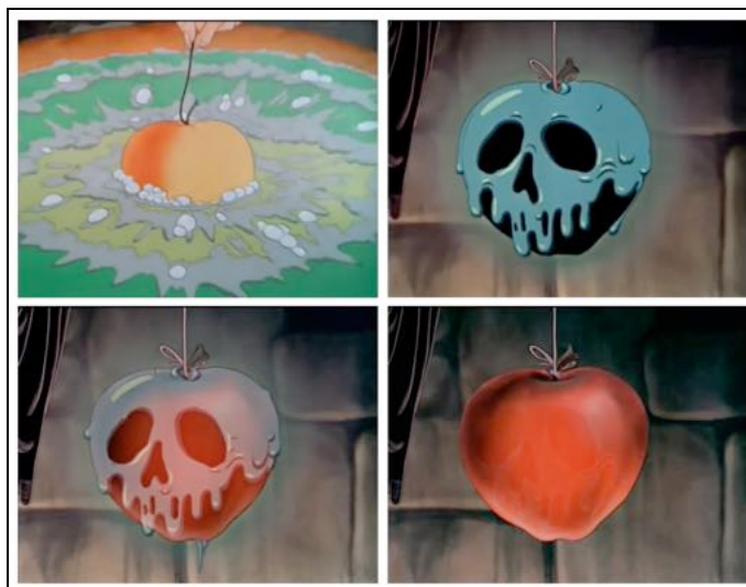
Figura 1 – Trasformazione “culturale” della mela avvelenata, fotogrammi da Biancaneve e i sette nani ( Snow White and the Seven Dwarfs ), © Disney 1937.

logica “bello da guardare, buono da mangiare” 1 ) in realtà non lo è . E di nuovo è la dimensione cromatica a giocare un ruolo di spicco in simile processo (Fig. 1): se la mela “naturalmente edibile” è di color giallo-arancione, il processo di culturalizzazione che la rende “bella”, ma al tempo stesso non commestibile (giacché letale), comporta l’assunzione di nuove tinte – dapprima il nero, con chiaro rimando plastico (che fa eco all’elemento figurativo descritto poco sopra) alla morte ( disforia ), e in seguito il rosso che ne enfatizza la piacevolezza, alla vista e dunque anche al palato ( euforia ).