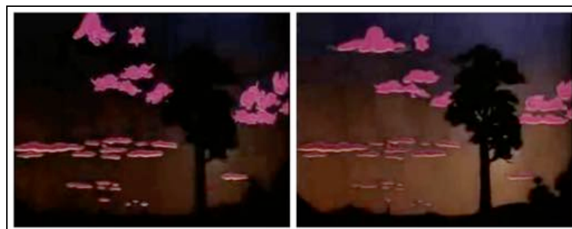
Figura 3 – Dall'allucinazione alla realtà, fotogrammi da Dumbo – L'elefante volante (Dumbo) , © Disney 1941.

Alla ritrovata armonia subentra infine la sonnolenza, che sancisce la fine dello stato allucinatorio: le figure degli elefanti rosa tornano a fondersi con quelle del mondo reale che circonda i due soggetti, trasformandosi nelle nuvole che riempiono il cielo del mattino in cui si risveglieranno di lì a poco (Fig. 3).