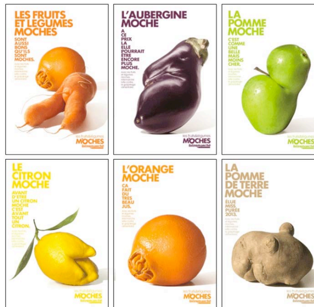
Fig. 7 – Poster della campagna pubblicitaria “Les fruits et légumes moches / Inglorious fruits and vegetables” (© Marcel Worldwide).

È interessante notare il processo di ri-semantizzazione che interviene a marcare una particolare “bellezza” (come sancisce lo slogan generale della campagna: “une belle idée contre le gaspillage”) – e addirittura “magnificenza” o “splendore” (“a glorious fight against food waste”), nella versione inglese – dei prodotti raffigurati, enfatizzando il programma narrativo entro cui questi sono inseriti (e investendoli così di un valore d’uso in vista di un valore di base morale, quello della lotta allo spreco alimentare).