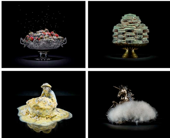
Fig. 1 – Immagini dal progetto fotografico “One Third”.