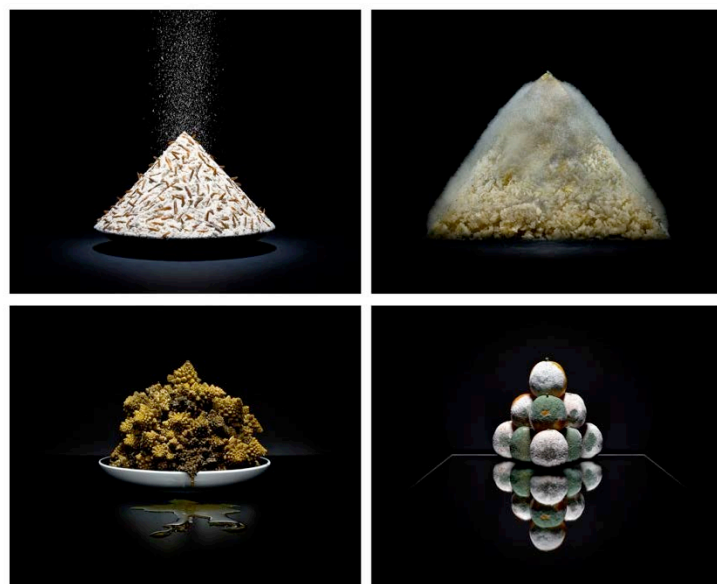
Fig. 2 – Immagini dal progetto fotografico “One Third”.