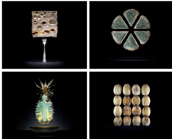
Fig. 3 – Immagini dal progetto fotografico “One Third”.

Estremamente interessante è anche il processo di graduale espansione e “sconfinamento” di funghi e muffe di vario tipo (Fig. 4) che intaccano tanto la materia-cibo quanto gli oggetti e gli utensili con cui essa viene a contatto, erodendo progressivamente il confine tra contenente e contenuto, esterno e interno, commestibile e incommestibile.