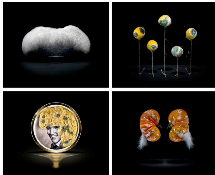
Fig. 4 – Immagini dal progetto fotografico “One Third”.

Estremamente interessante è anche il processo di graduale espansione e “sconfinamento” di funghi e muffe di vario tipo (Fig. 4) che intaccano tanto la materia-cibo quanto gli oggetti e gli utensili con cui essa viene a contatto, erodendo progressivamente il confine tra contenente e contenuto, esterno e interno, commestibile e incommestibile.