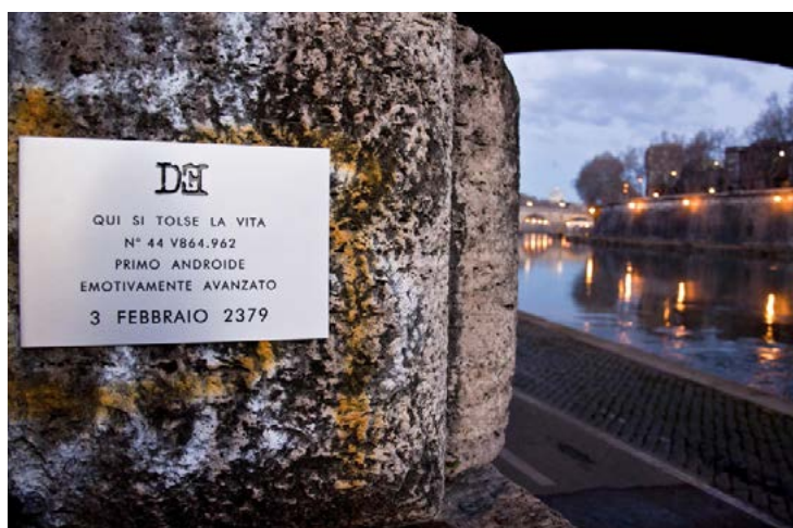
Targa 1 - Roma (zona Isola Tiberina)

Il primo viaggio nel Poi datato febbraio 2379 ci ha condotti nel luogo della sua morte, il Lungotevere romano all'altezza di ponte Garibaldi (Isola Tiberina). Nostro malgrado, quando siamo giunti a destinazione l'androide aveva già praticato il reset finale, dopo aver eliminato ogni suo back up. La seconda occasione in cui il cronotrasporto ci ha avvicinati a N°44 ha come data d'approdo il 9 gennaio 2292, qui abbiamo visitato la fabbrica dove venne assemblato.