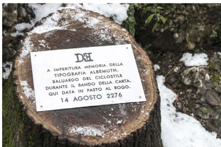
Targa 13 - Milano (Parco Indro Montanelli)

sopracitate in pietra, ma anticipano il Futuro e sono di conseguenza postate. Se ne trovano a Roma, Venezia, Milano, Bologna, Padova e altre località italiane.