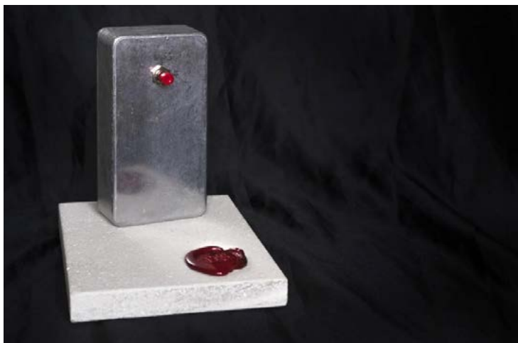
Radiocomando per teletrasporto, anno 2154

Per evitare rischi eccessivi, ci siamo comunque limitati a riportare dai nostri viaggi solo oggetti di piccole dimensioni e dal peso contenuto, tra questi: una penna a induzione (anno 2514), un frammento di muro (anno 2071), un ordigno miniaturizzante innescato ma inoffensivo per altri sette secoli (anno 2769) o un radiocomando difettoso (anno 2154).