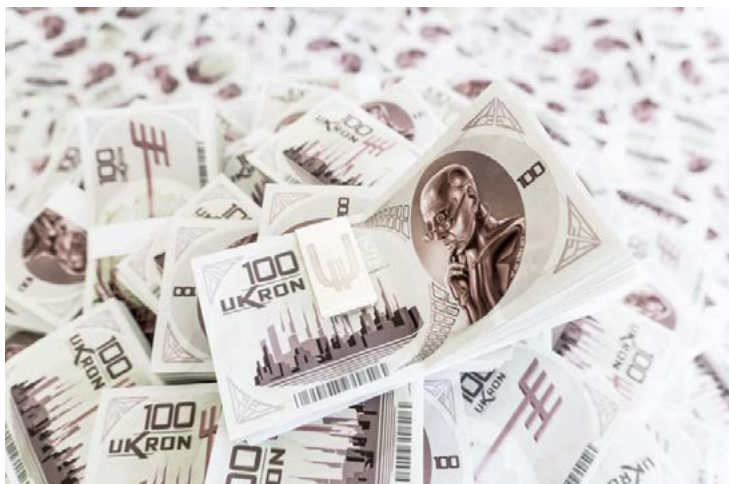
Banconote da 100 Ukron

Dalla conversazione con il Transumanista deduciamo che N°44 abbia goduto di una discreta popolarità per qualche mese, i media gli hanno dedicato molta attenzione, ma per un lasso di tempo limitato prima di riconsegnarlo all'anonimato. Questo non spiega come nell'anno 2504 all'emissione degli Ukron, la prima valuta globale, l'effigie dell'androide svetti sul taglio da 100. Inoltre, sulla stessa banconota compare la stilizzazione di un pomello del cambio menzionato dall'androide come prima stretta di mano tra Uomo e Macchina. Un tributo di questo spessore non può essere rivolto ad un personaggio popolare per solo una stagione.