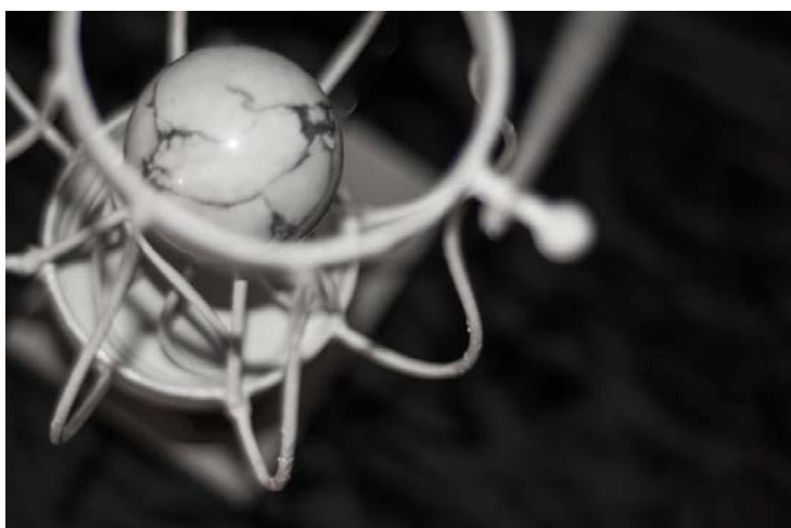
Ordigno miniaturizzante, anno 2769

Come spiegato anticipatamente, importare manufatti dalle dimensioni ridotte non comporta alcun rischio per la struttura spaziotemporale. Ben altra questione si apre se dal Domani viene introdotto nel Presente un manoscritto, perché non si sta più spostando solamente della materia, bensì anche dei concetti. Il Sapere collettivo è composto da una stratificazione d'idee amalgamate nei secoli, sequenziali e legate dal lavoro intellettuale di molti. Il Pensiero procede linearmente, ma possono anche avvenire bruschi salti nel momento in cui un'idea rivoluzionaria viene partorita. Basti pensare all'impatto avuto dall'introduzione di concetti quali il Sistema Copernicano o la Relatività Generale, eppure possiamo sostenere che una scoperta avviene solo nel momento in cui i tempi sono maturi per accoglierla. Vale a dire che non ci sarebbe stato alcun Richard Feynman, se nel 1600 Giordano