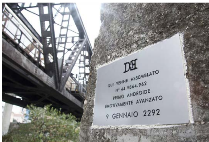
Targa 12 - Pescara (area portuale)