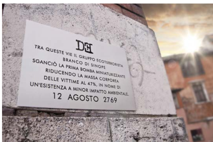
Targa 2, Roma (zona Trastevere)