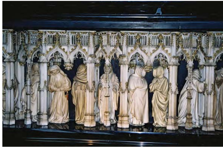
Figura 1. Claus Sluter, 1411, tomba di Filippo l’Ardito, Digione.

Per quanto riguarda le arti, secondo diversi interpreti la processione di gementi velati che Claus Sluter scolpì per il piedistallo della tomba di Filippo l’Ardito a Digione (terminata nel 1411) (Fig. 1) potrebbe avere come fonte d’ispirazione la storia del Sacrificio d’Ifigenia di Timante, nota a Sluter attraverso i riferimenti a Plinio degli enciclopedisti medievali (Freedberg 1995; Moffitt 2005).