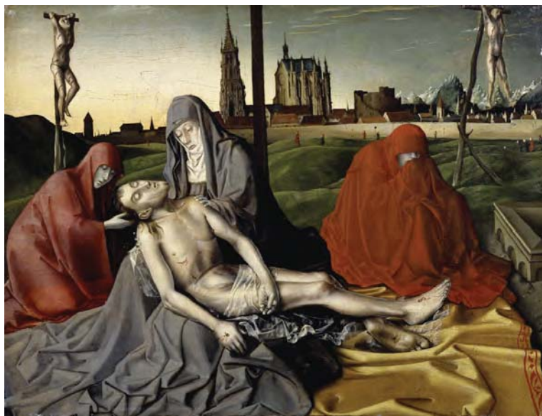
Figura 4. Konrad Witz, 1440 ca, Pietà , tempera e olio su tela, 33,3 × 44,4 cm, New York, The Frick Collection.

È questo il rischio connesso a un diffondersi della pornografia del dolore. Dal punto di vista della semiotica, non è tanto un rischio morale quanto un rischio simbolico. È il rischio di non distinguere fra il desiderio del dolore altrui, che ovviamente in una società è sempre fonte di disgregazione, e il desiderio dell'immaginazione del dolore altrui, che invece in una società potrebbe essere non una fonte di disgregazione ma di coesione. È soltanto se il dolore altrui mi si presen-