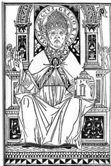
Gregorio Magno in una miniatura

«Maria Maddalena che aveva condotto nella città una vita di peccato, amando la verità lavò con le lacrime le macchie delle colpe [...] Insensibile, prima, a motivo dei peccati, poi, spinta dall'amore, ardeva in cuor suo. Venne infatti al sepolcro e non trovando il corpo del Signore, pensò fosse stato portato via e così disse ai discepoli che, venuti per constatare, prestarono fede alle sue parole [...] Vediamo nell'atteg-