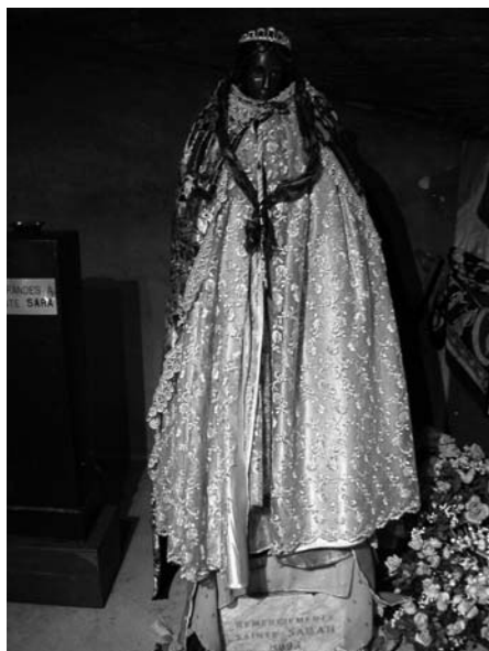
Statua di Sara Kalì

luogo, e le avrebbe accolte sulle rive della Francia, secondo un'altra versione. Di questa Sara c'è una statua di carnagione nera, nella cripta della chiesa della città.