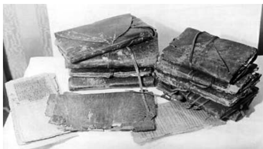
Da l'alto: Rotolo di Qumran e Codici di Nag Hammadi

I rotoli del Mar Morto, peraltro, non sono di papiro, bensì di pelle,