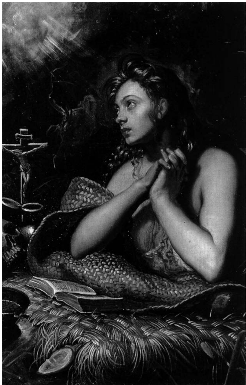
Tintoretto, Santa Maria Maddalena, Pinacoteca Capitolina, Roma.