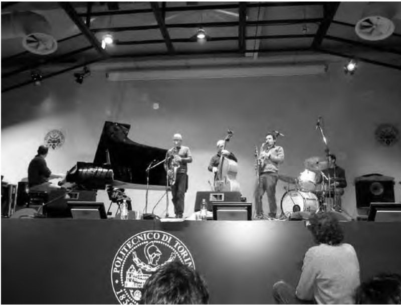
29 novembre 2010. Un momento della serata al Politecnico di Torino "Perché non sia l'ultima notte dell'università pubblica".