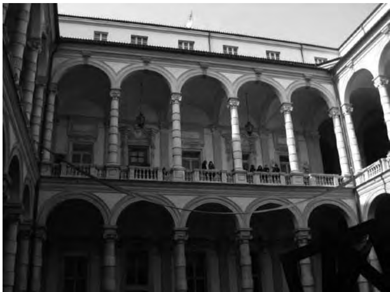
10 febbraio 2011. Lo striscione nel cortile del Rettorato.