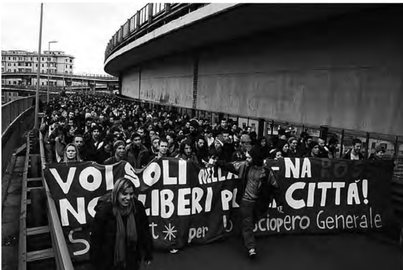
Roma, 23 dicembre 2010. Manifestazione nazionale contro la riforma Gelmini.