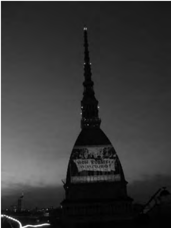
25 novembre 2010. Un'immagine della protesta proiettata sulla Mole Antonelliana.

L'occupazione della sommità di Palazzo Nuovo ha avuto però un suo complemento fondamentale in occasione del Torino Film Festival. In quel frangente, il direttore Gianni Amelio ha visitato il tetto, trascinando su di esso l'interesse mediale che investe il festival. Non a caso, l'intervento ha scatenato le proteste vibranti dell'amministrazione regionale di centro-destra, tra i finanziatori del TFF. Proteste che probabilmente in qualche misura dipendono dal successo di un'altro elemento "cinematografico" realizzato in contemporanea sul tetto. Grazie all'associazione "100 Autori Torino Piemonte" e al regista Davide Ferrario, è stato possibile installare sul tetto un proiettore che ha utilizzato un lato della cupola della Mo-