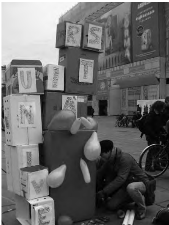
Torino, 30 novembre 2010. “Stanno distruggendo l’università pubblica”. In occasione della votazione alla Camera della legge Gelmini, una costruzione di scatoloni viene abbattuta “pezzo per pezzo” a ogni articolo approvato.