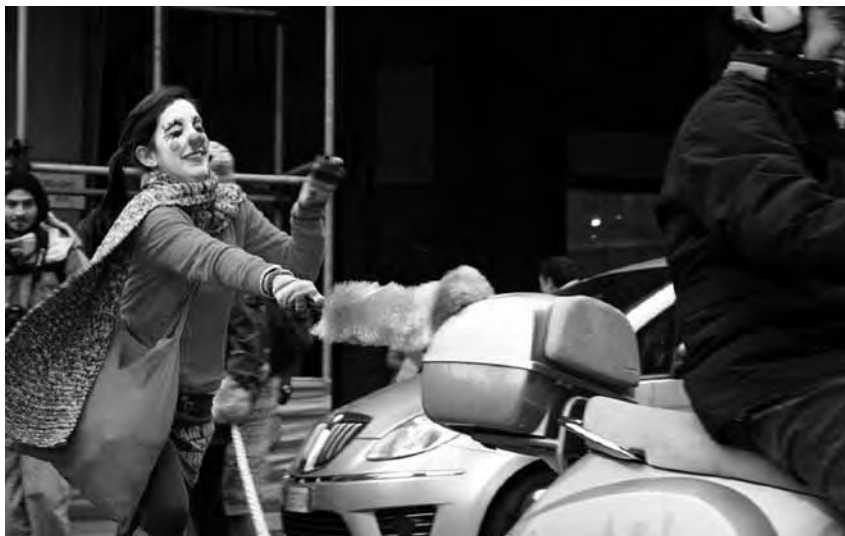
Torino, 23 dicembre 2010. Manifestazione nazionale contro la riforma Gelmini.