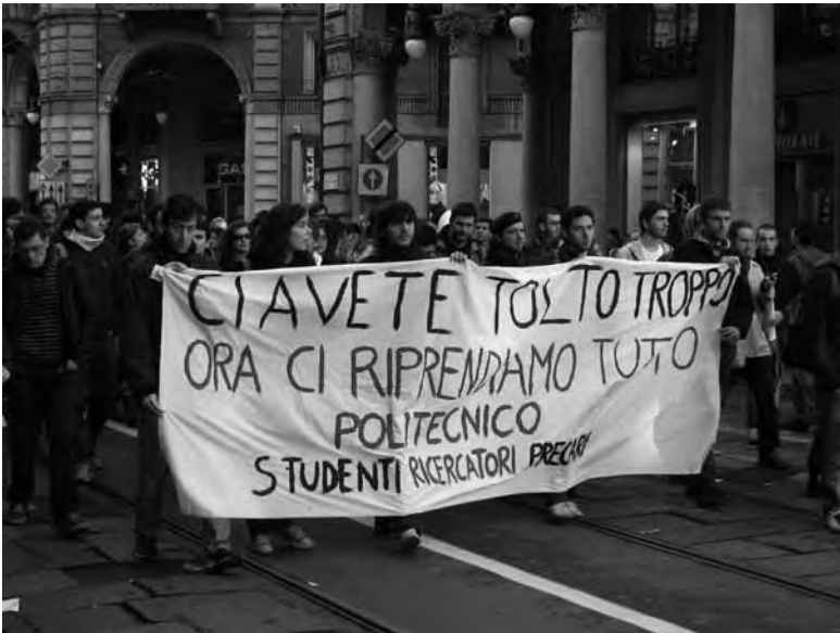
17 novembre 2010. Manifestazione nazionale per il diritto allo studio, Torino.