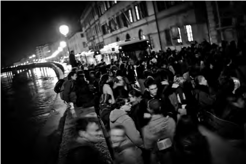
Pisa, novembre 2010. Manifestazione degli studenti.