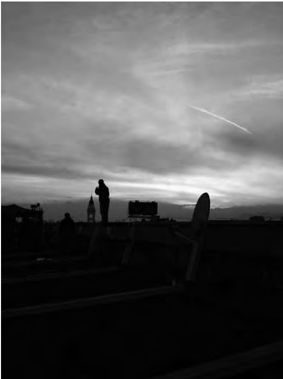
25 novembre 2010. Dal tetto di Palazzo Nuovo. Tramonto in cresta.

Un secondo asse semantico relativo alla spazialità, oltre a quello interno/esterno, è quello alto/basso. L'occupazione del tetto è allora insieme una resistenza all'assedio circostante e una difesa simbolica della parte più alta dell'università. La dimensione di estremità verticale del tetto stabilisce ovviamente una gerarchia visiva rispetto al piano stradale usuale, rispetto al quale ribalta l'asse di orientamento. Ma se la circolazione orizzontale è illimitata, l'ascesa verticale è invece una conquista. Proprio per la sua natura estrema, il tetto è un luogo che merita una visita: di qui la teoria di turisti della protesta, in primo luogo politici ma non solo, che hanno valorizzato il tetto, a differenza di quanto avvenuto per le manifestazioni. In particolare nel caso di Palazzo Nuovo, la