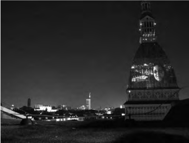
25 novembre 2010. Dal tetto osservandosi sulla Mole.

sizionata sul tetto di Palazzo Nuovo, uno degli elementi che vengono offerti alla vista attraverso lo schermo della Mole è proprio ciò sta accadendo in quel momento sul tetto. In questo modo, la conversione ottica reciproca della Mole e di Palazzo Nuovo è completa.