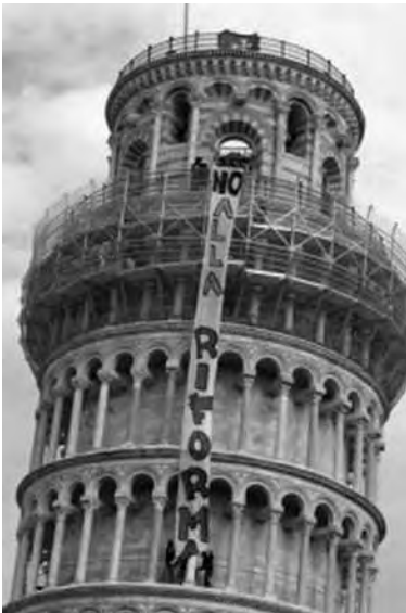
Pisa, novembre 2010. Studenti e ricercatori occupano i monumenti italiani.