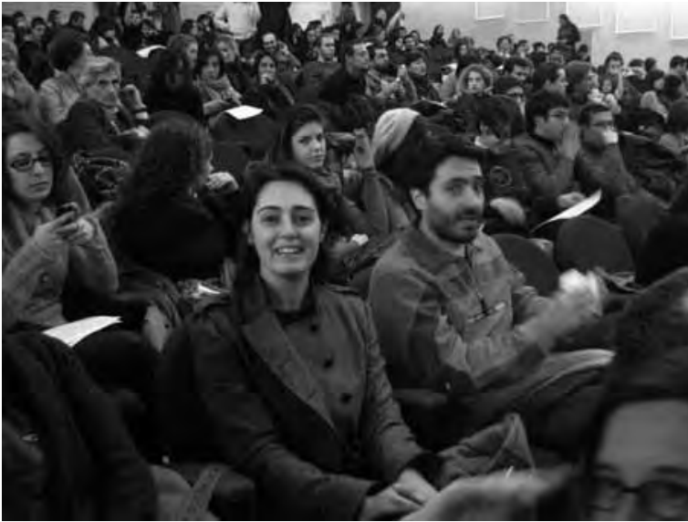
29 novembre 2010. L'aula magna del Politecnico di Torino gremita durante l'“Ultima notte dell'università pubblica”.

Tornando a Torino, un effetto curioso di questa effettiva efficacia della proiezione sulla Mole dell'occupazione dei tetti di Palazzo Nuovo si è avuto il 29 novembre, durante l'“Ultima notte dell'università pubblica”.