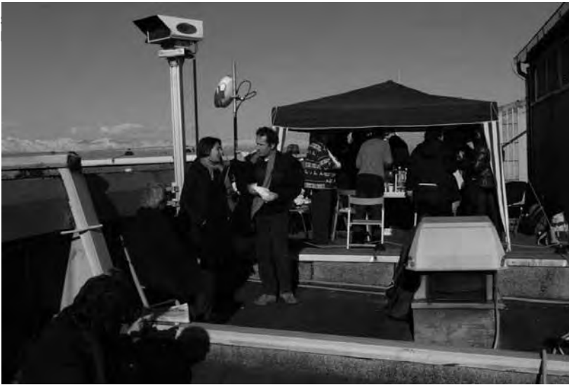
Novembre 2010. Dai tetti si vede meglio, Università di Torino.