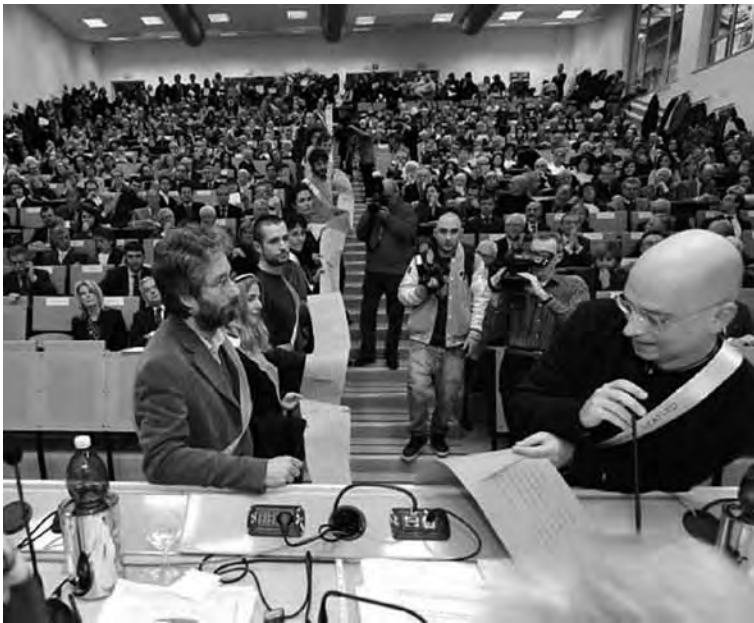
Torino, 31 gennaio 2011. Uno striscione rosa con ottocento firme viene srotolato fino al tavolo delle autorità e consegnato al rettore.

mente visibile, e che dunque non cerca ma invece assicura copertura mediatica. L'occasione di protesta è quella della discussione sui criteri di nomina della commissione che deve riscrivere lo statuto dell'ateneo. Al rettore che ritiene di esercitare il suo diritto di nomina e che concederebbe un delegato ai ricercatori, si oppone la richiesta di una rappresentanza garantita democraticamente, e non attraverso quote riservate. "No alle quote rosa": durante l'inaugurazione, uno striscione rosa che riporta ottocento firme viene srotolato fino al tavolo delle autorità e consegnato al magnifico.