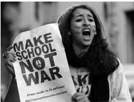
Novembre 2010. Studenti in piazza contro la riforma, Catania.